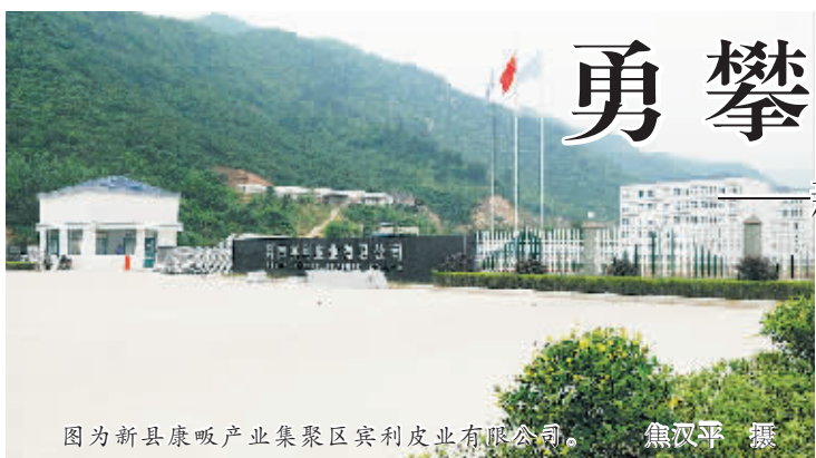
图为新县康服产业集聚区宾利皮业有限公司。