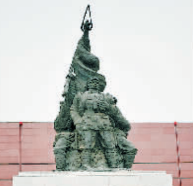
鄂豫皖革命纪念馆