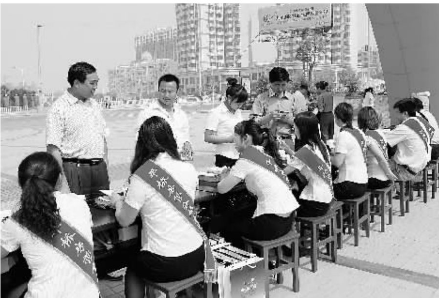
5月28日上午,平桥房管分局在平桥世纪广场举办了“每月一法”宣传活动。此次活动共设立展板20余块,现场发放宣传页2000余张,接待群众咨询200余人次,使群众进一步了解了房地产方面的法律法规及办事流程。图为活动现场。

据悉,此次培训会为期两天,与会人员将通过听报告、座谈讨论等方式,系统学习函授教育教学管理的相关规章制度,总结近两年教学管理工作情况,通报问题和交流经验。