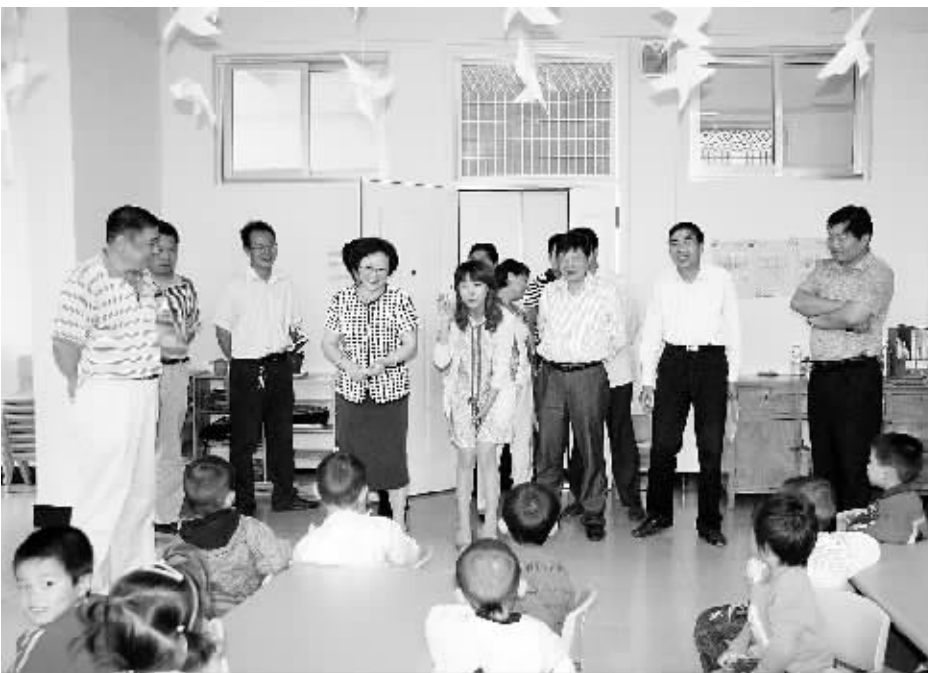
5月30日,市人大常委会组织部分常委会委员和人大代表对我市学前教育发展情况进行调研。调研组先后实地查看了新县和平桥区的部分公办及民办幼儿园建设情况。图为调研组在新县一幼儿园调研时的情景。

活动现场充满了热烈的喜庆气氛。小朋友们个个精神饱满、神采飞扬,踏着欢快的节拍,尽情舞动,放飞喜悦,用蓬勃的朝气传递着健康和快乐,让前来观看节目的家长眼前一亮。喜悦的笑脸、激动的心情和阵阵掌声,使幼儿园成了歌声和欢笑的海洋。