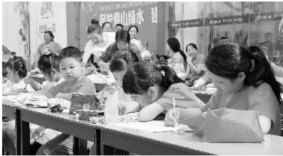
5月29日上午,市科所举行了“宽景一品杯”庆六一儿童绘画大赛,近50名少年儿童参加了绘画大赛。图为绘画大赛时的情景。

州饮茶爱好者领略了中国最北方茶区红茶的魅力,更以其独特的品质赢得了广州茶人的青睐。广州市茶文化促进会会长郭梦兆出席2011“信阳红风暴”广州活动周启动仪式后,与市长郭瑞民等共同参观2011春季中国(广州)国际茶业博览会。走到“信阳红”展位前时,他以“信阳毛尖信阳红,相映生辉共繁荣”来评价信阳茶产业的发展。 万人“叹”茶,成为新闻媒体竞相报道的亮点。新华社广东分社、南方日报、广东卫视、广东人民广播电台、广州日报、羊城晚报、广州电视台、南方都市报、广州人民广播电台、香港商报、民营经济报、新快报、信息时报、人民网、新华网、新浪、网易、腾讯网、河南日报、河南电视台、河南人民广播电台、大河报、东方今报等新闻媒体纷纷现场采访两地茶人。 郭梦兆在接受河南电视台采访时说,过去人们只知道“信阳毛尖”,不知有“信阳红”。我们愿意帮助你们打造一个好的平台,帮助你们宣传推广“信阳红”,让广大的广州市民都知道在河南信阳有一个响当当的红茶品牌,就叫“信阳红”。我还要告诉广州的茶人,不仅要喝“信阳毛尖”,还要喝“信阳红”。喝“信阳红”,别有一番滋味在心头!