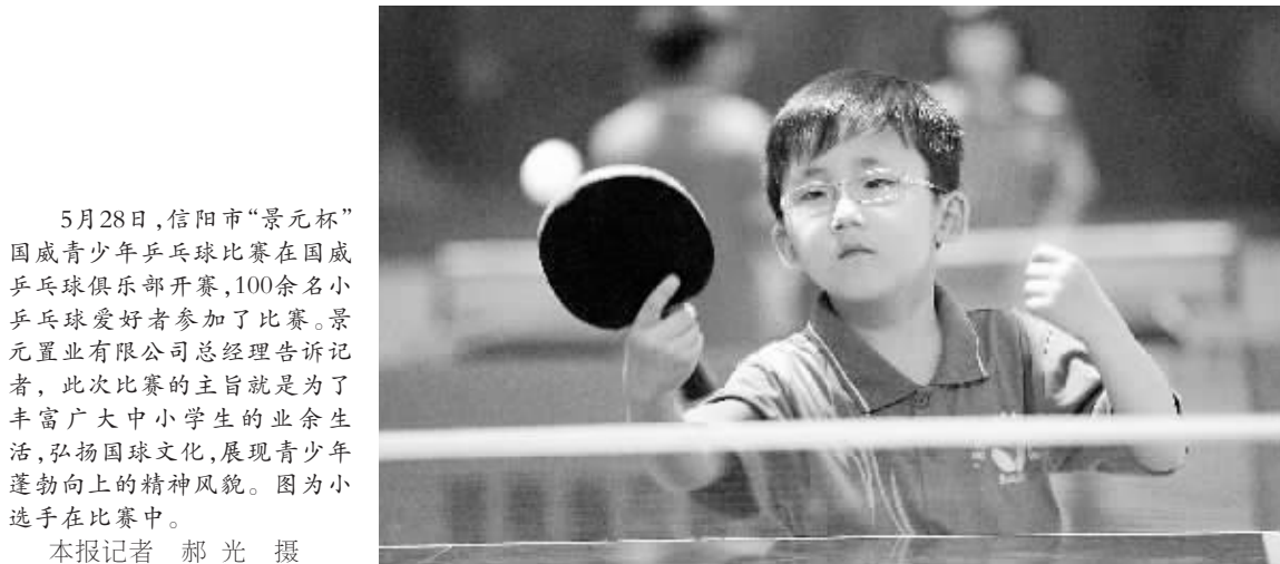
5月28日,信阳市“景元杯”国威青少年乒乓球比赛在国威乒乓球俱乐部开赛,100余名小乒乓球爱好者参加了比赛。景元置业有限公司总经理告诉记者,此次比赛的主旨就是为了丰富广大中农、小学生的业余生活,弘扬国球文化,展现青少年蓬勃向上的精神风貌。图为小选手在比赛中。