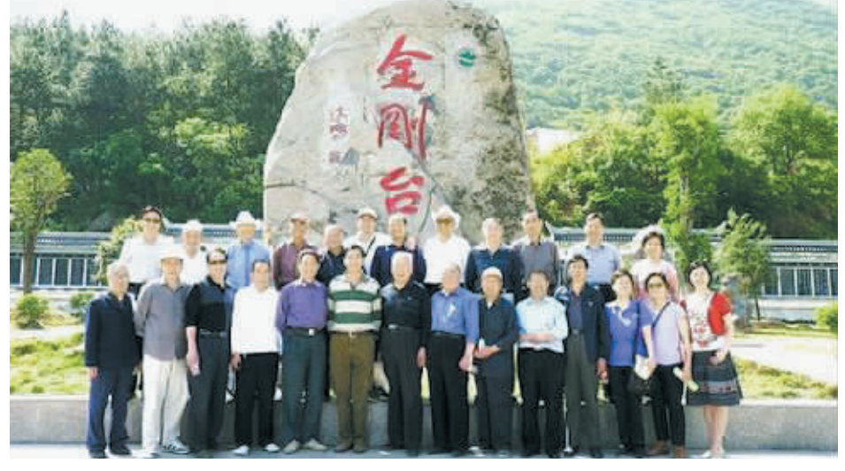
近日，信阳中级法院组织离退休干部到罗山县、商城县进行了为期两天的参观考察。近年来，该院党组非常重视老干部工作，积极采取措施落实老干部的政治生活待遇，将每年的参观考察，作为让老干部亲身体验改革开放成果，活跃、丰富老干部精神文化生活的重要内容，作为加强老干部思想政治工作的有效形式。图为该院老干部在商城县金剛台考察时合影留念。