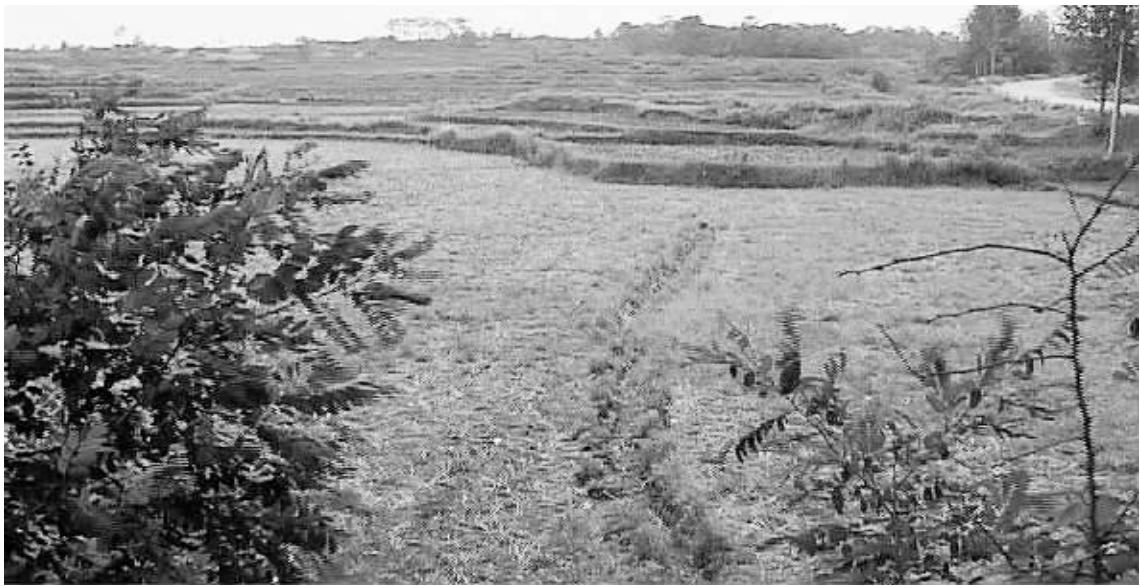
图为我市因缺水无法进行水稻插秧的田地。