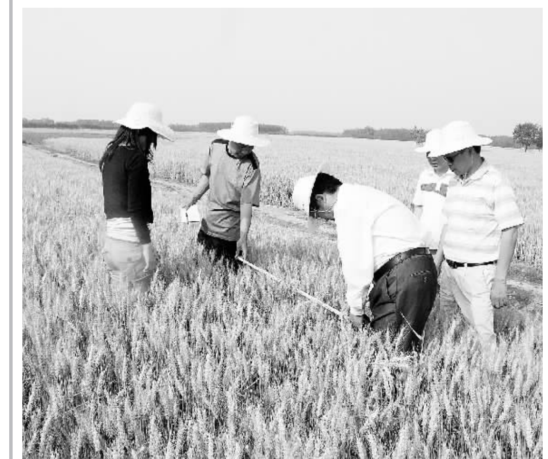
息县是我市小麦主产区和高产区。日前,由省、市、县组织的10位农艺专家,来到息县东岳镇杨庄村万亩小麦示范区,进行测产验收工作,经过一整天的紧张工作,科学测算之后得出的结果是,息县万亩小麦示范区小麦亩产达到505.7公斤,增产55公斤,比非示范区多收96.7公斤,达到了示范区的预期目标。图为农艺专家们正在测算小麦产量时的情景。

由于价格便宜,人力三轮车是不少市民出行代步的首选。对于三轮车收费价格的上涨,一些市民也