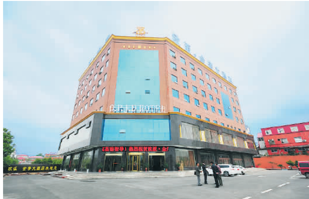
欧派·金帝大酒店外景