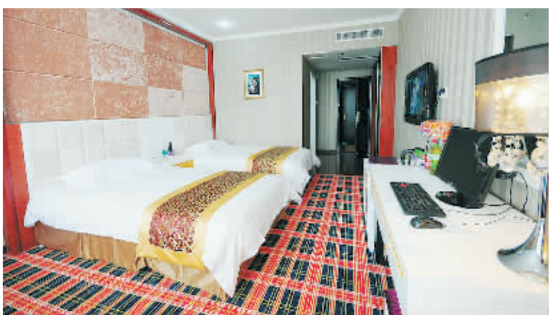
客房可随时上网办公

欧派·金帝大酒店是集中西餐饮、客房、KTV会所于一体的高档特色酒店。酒店设计新颖、设施豪华、服务一流。既有适合宴请、商务接待的中餐厅,又有时尚、新潮的西餐厅,同时还对外提供大型商务冷餐服务。酒店内设各类客房150套,并配有可容纳百人的会议室。园色天香会所拥有多个大小中包房,豪华大包房可供70人举办舞会。会所一律实行透明消费。 地址:信阳市南京路金三角 餐饮:3222111 住宿:3201111 KTV会所:3222000