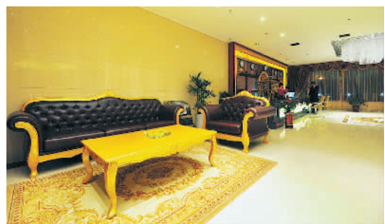
宽敞舒适的休息厅