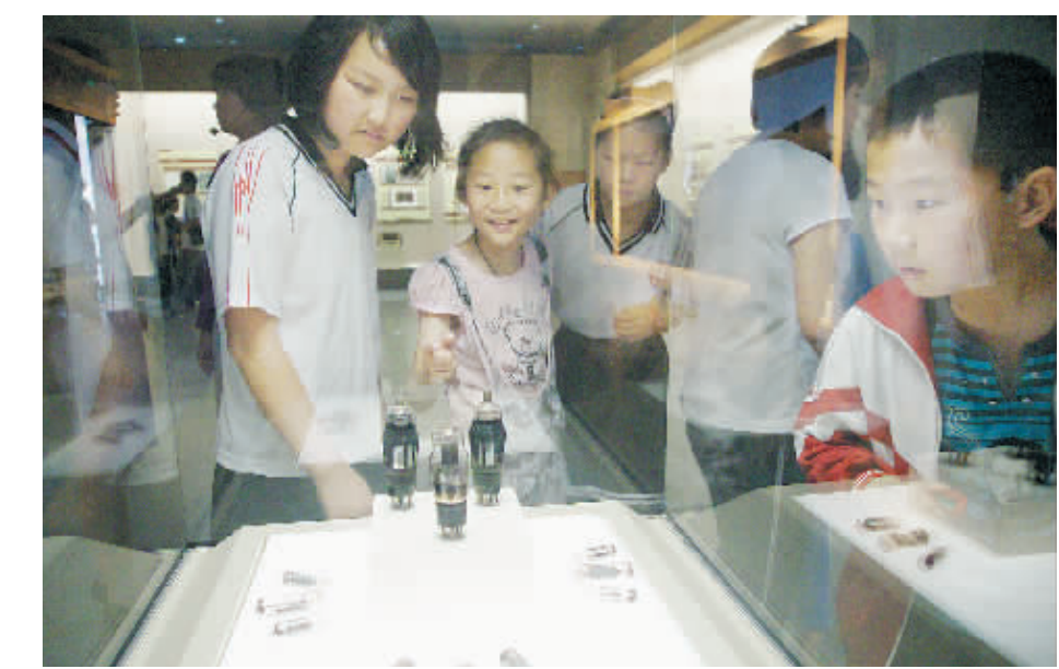
今年的 5 月 18 日,是第 26 届国际博物馆日,宣传主题是“博物馆与记忆”。结合这一主题,信阳博物馆先后举办了穿越时空的记忆——鸡公山万国别墅图片展、恒久的记忆声音的收藏——中国收音机藏品展等专题展览。图为平桥区第二小学的学生在信阳博物馆参观。

本报讯(姚广义)信阳市通过开展行政审批项目清理、办事“阳光操作”,建立有效监管体系等措施推进“零阻碍”服务,有效促进全市经济快速发展。“十一五”期间,该市国民生产总值持续保持两位数增长,总量由 5 年前的 508 亿元增加到 1092 亿元,人均收入也由 6473 元增加到 15000 元实现翻番目标。 “零阻碍”服务,是指各类企业在到信阳落户、建厂、生产、经营和发展的过程中,地方政府及其相关职能部门要按照依法、简便、高效、廉洁的要求为企业服务,做到涉企服务“零阻碍”,严格防止各类影响企业发展的吃、拿、卡、要及行政不作为、乱作为、慢作为等阻碍企业发展的行为发生,为企业发展创造宽松高效、风清气正的好环境。 为使工作落到实处,该市去年由纪检监察机关牵头,政府法制办、编办、财政、物价和行政服务中心等职能部门密切配合,利用 5 个月的时间对现行行政审批服务项目进行清理,取消、合并、下放了一批项目。全市清理后保留各类行政审批服务项目 462 项,比清理前减少 168 项。其中取消项目 46 项,下放县区项目 27 项。 让行政审批“阳光”操作是信阳市推进“零阻碍”服务的又一有效途径。该市委、市政府专门发出公告,要求市属各部门所有行政审批服务项目必须全部进驻市行政服务中心办理,不设任何门槛。针对在推进项目进中心办理过程中,一些部门不愿放权、不愿进驻的问题,市纪检监察局一个项目一个项目审核,一个单位一个单位过关,现场督办,对行动迟缓、工作不力的 17 个部门进行通报批评。该市还要求,所有有关职能单位进驻中心后,要将审批事项、审批条件、审批程序、审批期限全部公开,接受社会监督,使办理环节更阳光。 在工作中,该市纪检监察机关也不断加大对行政审批工作的督查力度。他们一方面建立部门业务即时监控、窗口电脑动态监控、远程视频监控、音频监控等多位一体的立体式监控网络,加大对行政审批工作的日常监督。另一方面,成立驻市行政服务中心督查室,协调处理行政服务事项办结过程中需要解决的问题,实时跟踪落实,坚持每季度对该中心办件情况进行督查,对违反行政审批服务规定的所有问题进行督办。 据了解,去年以来,该市共查处影响干部作风建设和优化经济发展环境问题 257 起,处理违规人员 466 人,其中涉及科级干部 72 人、处级干部 6 人。(原载 2011 年 4 月 27 日《中国纪检监察报》)