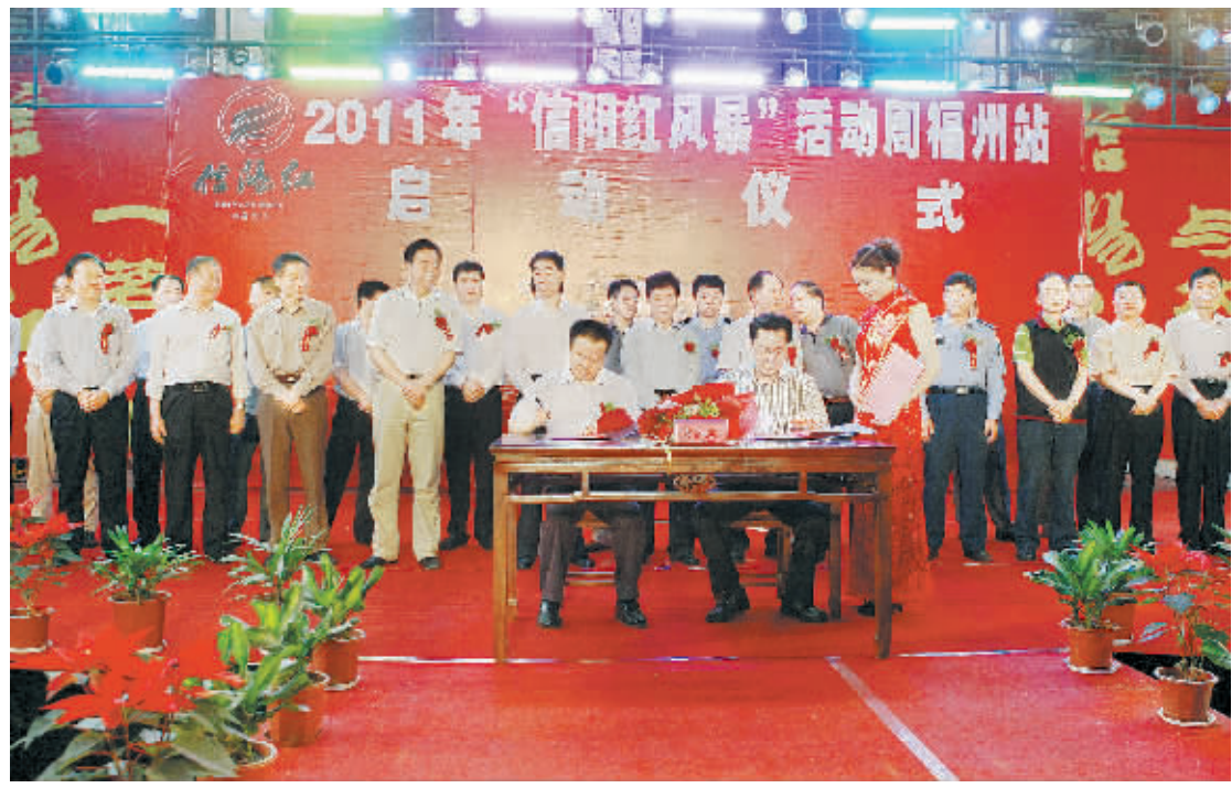
5月20日,2011年“信阳红风暴”活动周福州站启动仪式举行。启动仪式上,浙河区政府与福建八马茶业有限公司签订了茶产业战略合作协议。

本报讯(记者 王菲 胡瑜珊) 办,海峡茶业交流协会支持,信阳地分南北物华天宝有奇能,谊联豫闽情浓于水信阳红。5月20日,由中共信阳市委、信阳市人民政府主