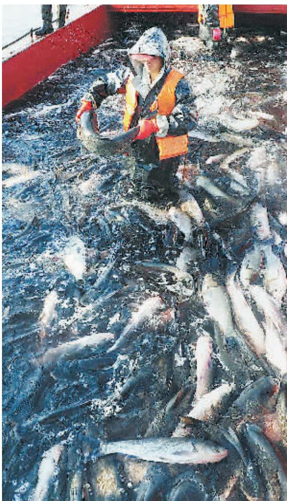
在河南省信阳市南湾水库,渔民在捕捞船上捞取鲜鱼。

据河南省统计局地调队公布的数据显示,2010年河南省农民人均纯收入达到5524元,比2001年增加了3538元,增长了1.78倍,年均增长10.8%,工资性收入日益成为农民收入的重要来源。