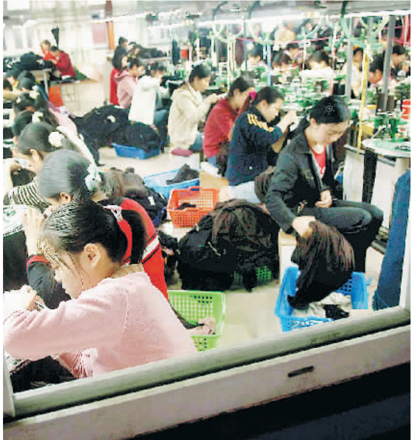
在河南省固始县一家农民工占90%的针织品企业车间内,工人们在加工产品。