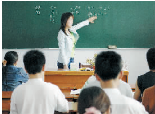
在河南省新县劳务外派培训中心,赴日本的务工人员在学习日语。

河南省工业和信息化厅 河南省公安厅 河南省监察厅 河南省国土资源厅 河南省人民政府国有资产监督管理委员会 河南省工商行政管理局 河南省安全生产监督管理局 河南煤矿安全监察局