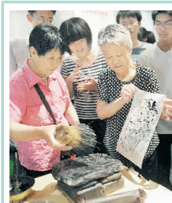
5月18日,几名郑州市民在河南省博物馆举行的“把博物馆带回家”活动中,自己动手印制朱仙镇传统木板年画。当日是第35个国际博物馆日,今年的主题是“博物馆与记忆”。全国各地的博物馆纷纷推出专题展示、系列讲座、观众互动、文物鉴赏等活动。让更多的人了解博物馆,并让更多有关历史与收藏的细节变成公共记忆。不少博物馆还在当天免费对公众开放。

陶德田表示,今后凡发生重大铅污染事件以及由铅污染引发群体性事件的国家环境保护模范城市和生态建设示范区,一律立即撤销其国家环境保护模范城市和生态建设示范区称号,三年内不再受理其申请。