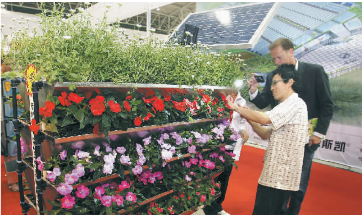
5月11日,在北京全国农展馆举行的国际现代农业展览会上,参展商向观众介绍“智能农业”工作性能。当日,第二届北京国际现代农业展览会在全国农业展览馆开幕。本届展会汇集了近300家国内外企业,展现了当前世界现代农业的最新技术与装备,吸引了众多专业人士到场参观。

“防灾减灾从我做起”,不仅要体现在“防灾减灾日”,更要深入到我们生活中的每一天。让我们都来关注防灾减灾,让知识成为守护生命的力量,为自己、家人和朋友构筑起一道抵御灾害的坚实防线。(新华社北京5月11日电)