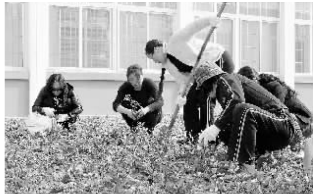
平桥房管分局利用双休日时间,组织青年干部职工在机关办公区域开展义务植树活动,美化办公环境。图为植树时的情景。