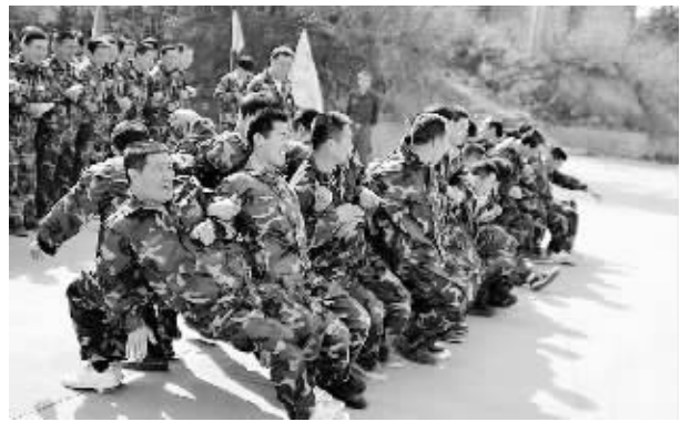
固始县城市管理综合执法大队注重加强队伍建设。近日,该大队组织一线执法人员参加拓展训练。