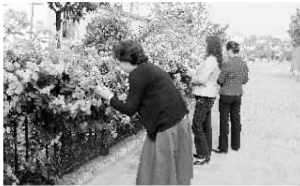
眼下,位于南湖路的奥林匹克园内的月季花竞相绽放,犹如花的海洋,引来许多市民驻足观赏。