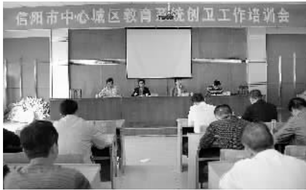
日前,我市举办了中心城区教育系统创卫工作培训班,各学校负责同志参加了培训。图为培训时的情景。

据了解,为更有效地鼓励城镇企业招聘退伍兵,该县人武部决定凡接纳退伍兵30人以上的企业,可优先为其建立民兵组织,并根据企业生产发展实际,帮助企业组建防火救援、应急抢险、车辆维修等多样化的民兵分队,配备相应的器材,有重点地向退伍军人相对集中的企业实施政策资源配备,逐步建立经济军事兼顾、市场战场双赢的融合发展机制,全县上下退伍兵就业初步形成了“你就业我服务,你发展我强兵”的氛围,呈现出地方经济发展与国防后备力量建设双赢的格局。