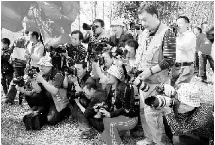
近日,河南省新闻摄影学会和新乡县人民政府联合举办了“河南媒体记者聚焦新县”采访活动,40多名知名摄影记者齐聚新县,品读红色文化,探访绿色生态,反映发展成就,领略豫风楚韵。图为摄影记者在采访时的情景。

张春香指出,魅力信阳、文化为魂。本次书法展体现了文化与城市建设的结合。滨河新八景延续了信阳历史文化文脉,特别是茗阳阁,作为信阳的城市地标,体现了非常典型的茶文化,开启了信阳城市建设的