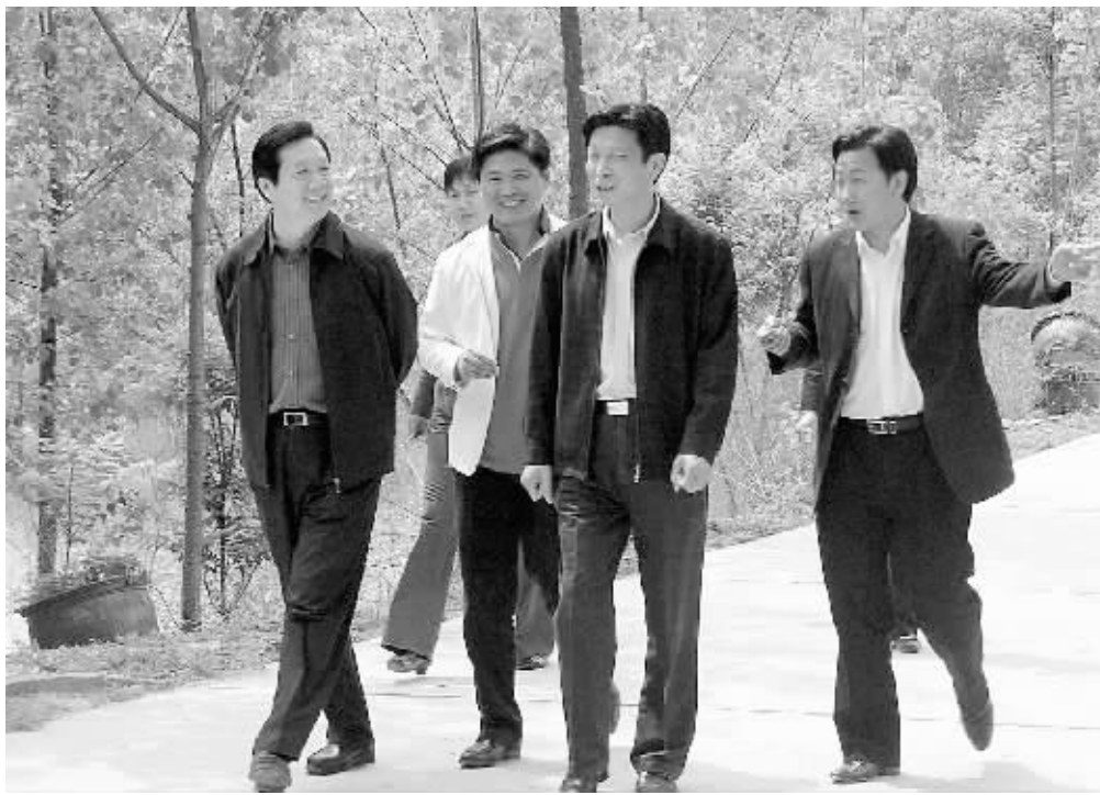
市长郭瑞民(左一)在五岳集团视察指导工作。