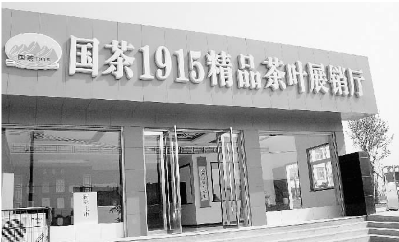
五岳集团茶叶展销厅。