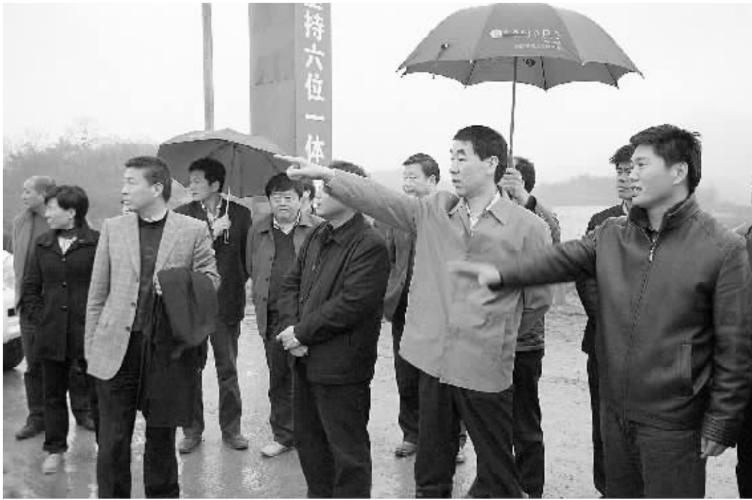
市委书记王铁(右二)视察五岳集团茶场。