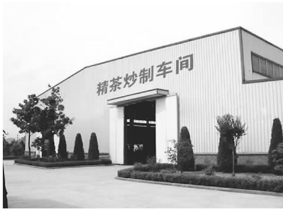
五岳集团精茶炒制车间。