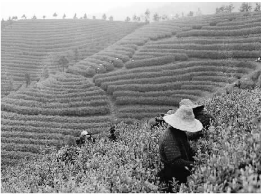
五岳集团万亩茶叶基地。