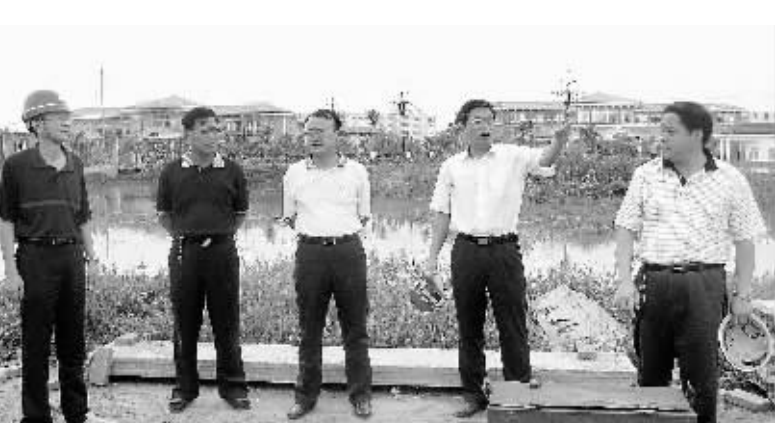
潢川经济开发区党委班子到项目施工现场检查指导工作。