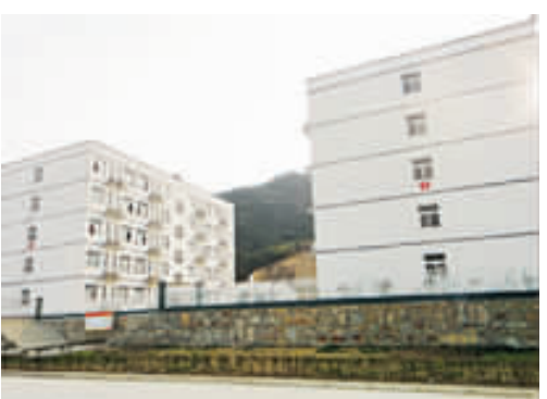
新县公共租赁住房项目