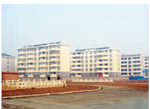
南湾惠民小区经济适用住房项目