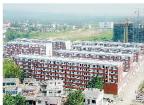
商城县美人岗小区廉租住房项目