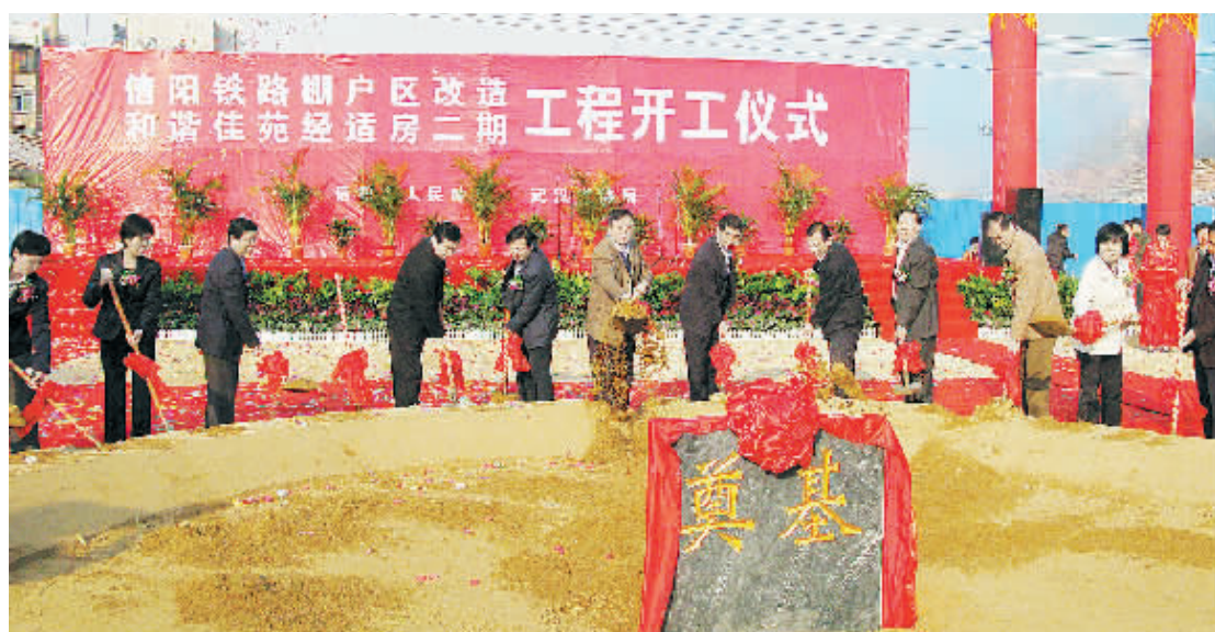
副省长张大卫、市委书记王铁、市长郭瑞民等领导参加信阳铁路棚户区改造开工奠基仪式

2011年,我市将进一步加大住房保障工作力度,采取有力措施,推进住房保障工作深入开展,切实把这项德政工程、民心工程、安居工程办实办好,努力实现“群众得实惠、企业得市场、地方得发展、党政得民心”的良好局面,让省委、省政府放心,让我市广大群众满意。