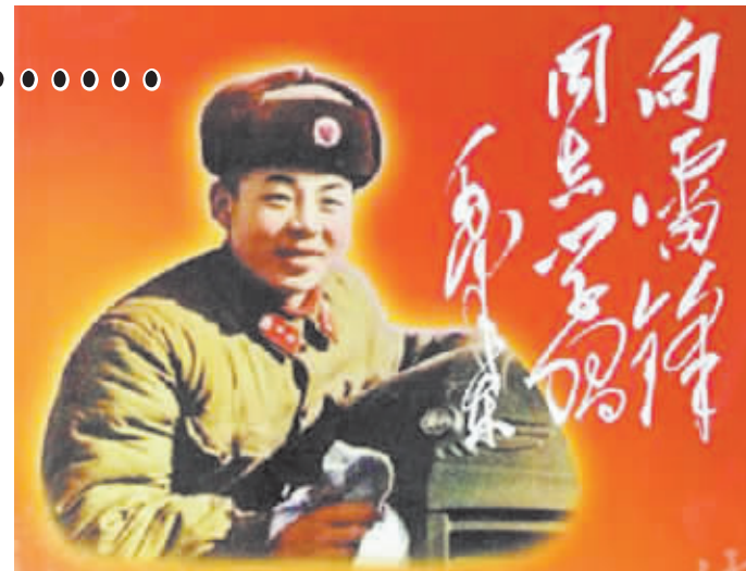
雷锋精神感动数代中国人(资料图)

意间,你也就已经成了“活雷锋”,在用自己的实际行动诠释雷锋精神、传承雷锋美德,将学雷锋变成了一种发自内心的“赠人玫瑰,手有余香”的举手之劳…… 美国《时代周刊》曾如此称赞:“雷锋品牌是中国人民也是全人类共同的精神财富。”是啊,几十年来,无论我们培养和树立了多少精神偶像,在平凡中默默奉献、无私奉献,在帮助他人中获得内心快乐的雷锋永远是抚慰我们心灵的可亲、可信、可学的现实榜样,雷锋精神一直没有随时光的流逝而褪色,也没因世事的变迁而消失,反而在实践中不断赋予新的时代内涵,成了新时代精神文明的同义语,具有穿越时空愈久弥新的永恒魅力,在温暖着你我,感动着这个世界。 48年前,一个伟大的生命陨