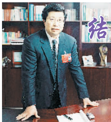
图为海信集团有限公司董事长周厚健