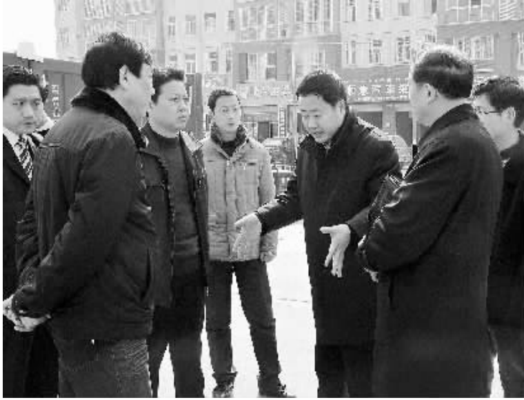
市城市管理综合执法局负责同志正在督导城市市政基础设施建设。

本报讯(记者 常征)没有出正月,不少市民发现天蓝色的施工围挡出现在中心城区的民权街、南京路上,广大市政施工人员以及大型机械正在道路上紧张地忙碌着……据悉,今年,中心城区的路、桥状况可望大改观,并新增3座人行立交桥。