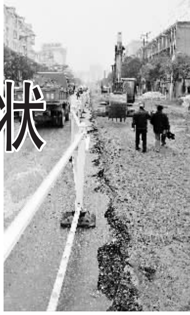
民权街道路改造现场。

“一路一桥关乎行,全心全意为人民。”就中心城区道路整修时如何尽可能地实现便民?记者了解到,整个施工过程中,有关部门要求不全部封闭道路,半边施工、半边通行,主车道施工、人行道不施工,以及采取搭建便民桥等措施。同时强调,既要考虑道路通行问题,又要避免二次开挖造成浪费。如:立体绿化、灯光亮化、路边停车场、人行道改造同步跟进;铺设弱电管道、雨污分离管道,为相关部门铺设线路、处理污水提供方便。此外,所有施工单位都购买了注水式施工围