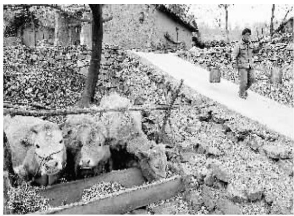
2月21日,在河南省嵩县何村乡姜岭村,一位村民挑着从离村很远的一个水塘取来的两桶水,准备让牲口饮用。 目前,河南全省大部分地区连续130多天无有效降水,除了2900万亩小麦受灾外,北部和西部山区的农民吃水也出现困难。