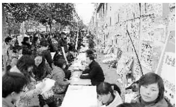
2月22日,应聘者在郑州市金水区的一个路边招聘市场进行咨询,墙壁上挂满了各类招聘信息。 春节过后,河南省郑州市的多个大型人才市场的街头招聘市场十分热闹,这些自发形成的街头人才和劳务市场成为用人单位和应聘者的重要就业信息平台。

乐大典》、《大宋·东京梦华》、《君山追梦》、《水秀》等大型实景旅游演艺节目深受海内外游客喜爱。 在河南,“开发一个洞,富了一个村”“开发一处景,富了一个镇”的现象屡见不鲜。去年河南省实施了“百村万户”旅游富民工程,支持128个村和1万户农家乐发展旅游,共计为农村提供10万个就业岗位。 “十一五”期间,河南旅游产业规模迅速发展,目前全省有中国优秀旅游城市27个、A级景区185家、星级酒店512家、旅行社1158家。全省旅游从业人员从5年前的43万增加到120多万。“十一五”期间,河南全省完成旅游投资总额超过400亿元,招商引资签约金额超过500亿元。