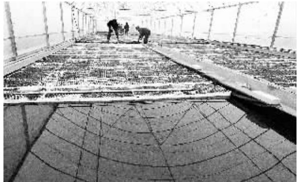
2月22日,村民在育苗大棚的水面上摆放烟苗营养钵。 在河南省嵩县阎庄镇,一座占地面积26680平方米、共建有育苗大棚30座的烟苗培育中心于近日投入使用。由于采用水上漂浮式营养钵育苗新技术,不仅烟苗成活率高,而且节约育苗成本。据了解,该中心可一年四季轮作作业,春天育苗,夏秋种大棚蔬菜,冬天培育催花牡丹,不仅提高了土地利用效率,也使产值实现翻倍。 新华社记者 王頌 摄

新学期开学了,中小学生们背着书包又走进了学堂。记者长期跟踪调查发现,不少中小学生的书包中塞着各种各样的教辅书,有的书包中教辅书重量远超过教材书重量。更甚的是一些教辅书良莠不齐、鱼目混珠,低劣、拼凑、抄袭的居多,有的甚至错误百出,以讹传讹,对孩子造成误导和伤害,令人担忧! 新华社发