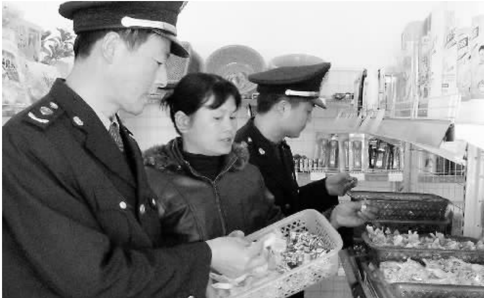
近期,鸡公山工商分局大力加强农村食品市场监管,确保农民群众放心消费。图为昨日该局执法人员正在部分超市检查食品标识。

当前,天干物燥,森林防火形势严峻,但在市部分乡村,田野里烧田坎草留下的痕迹屡见不鲜。因为昨日上午,光山县南部一省级公益林区旁,田埂上的枯草正吐着火舌顺风蔓延,后来所幸被人及时扑灭。