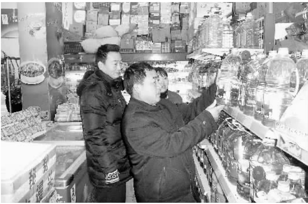
连日来,我市物价管理部门工作人员深入辖区内各类商场进行检查,查处价格违法行为,稳定市场价格,维护群众利益。图为检查人员在超市了解市场供应情况。

该县积极发挥编制外团副书的作用,拓宽了团组织联系青年和整合资源的渠道;与驻外团工委所在的输入地团组织进行沟通衔接,探索建立双向协作共建共管新机制;借助党建成果,积极探索和推产业链建团、依托建团等模式,使非公有制经济组织、新社会组织团建工作在原有基础上有了明显提高。该县牧业养殖专业合作社荣获“河南省服务农村青年创业致富先进集体”称号,是全市唯一荣获该奖项单位。