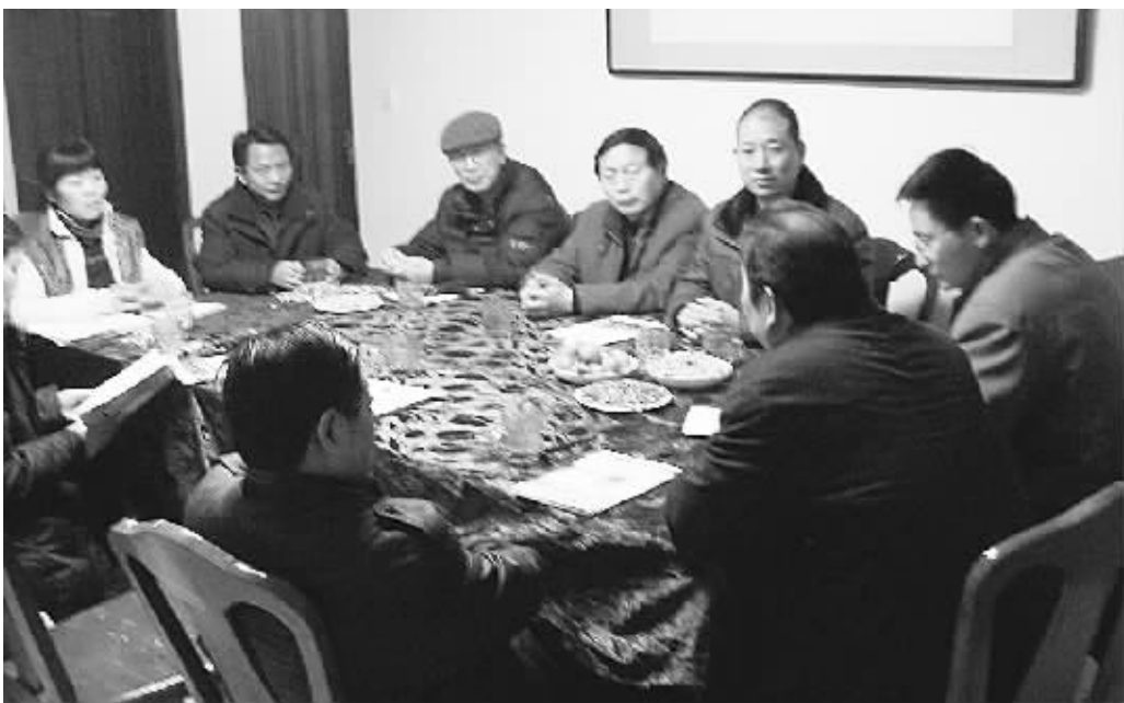
近日,浙河区作家协会新春茶话会在信阳书画堂举办。浙河区文联、作家协会的负责人和作家们济济一堂,总结过去,展望未来。作家们一致承诺,在新的一年里,多创作和发表精品佳作,为魅力信阳建设和繁荣信阳文艺事业增添光彩。