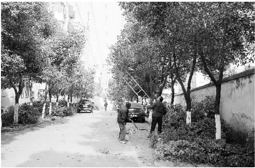
为防止积雪、冰凌压弯树枝搭上电线,影响供电,危害行人安全,电力部门每年都要对高压线旁的树木进行修剪。图为昨日上午,市电力部门工作人员受报晚新村物业处委托,锯掉小区内可能危害供电安全的树枝。