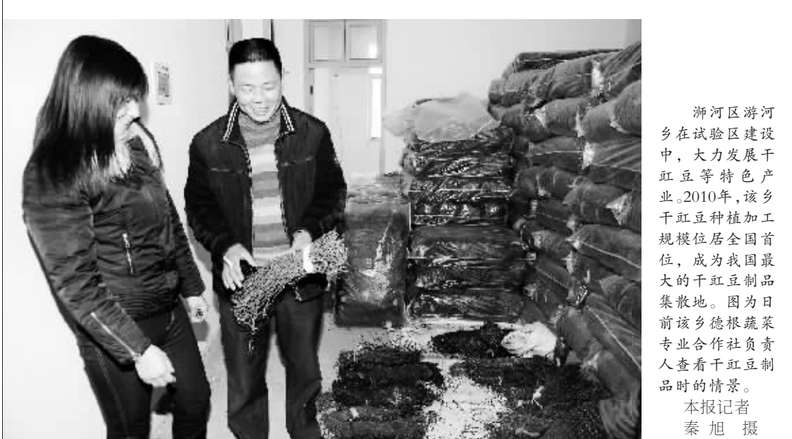
浉河区浉河乡在试验区建设中,大力发展干红豆等特色产业。2010年,该乡干红豆种植加工规模位居全国首位,成为我国最大的干红豆制品集散地。图为日前该乡德根蔬菜专业合作社负责人查看干红豆制品时的情景。