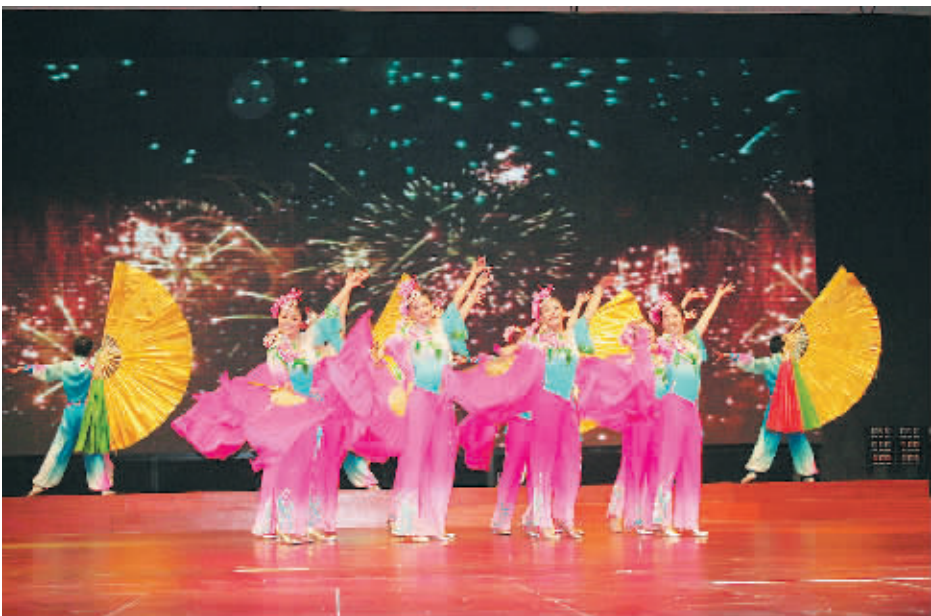
12月23日晚,由市委宣传部主办,淮滨县委、县政府承办的“百花之夜·民歌飞扬”文艺展演淮滨县专场晚会在百花之声会堂精彩上演。晚会共分乡、情、人3个篇章,充分展现了淮滨县悠久灿烂的文化、淮河人民奋发向上的良好精神风貌和对未来美好生活的向往。

会议决定,市三届人大常委会第二十六次会议于12月28日召开。会议的建议议程如下:1. 审议市人民政府关于市三届人大五次会议01号议案办理情况的报告;2. 审议市人民政府关于贯彻实施《中华人民共和国残疾人保障法》情况的报告;(下转第二版)