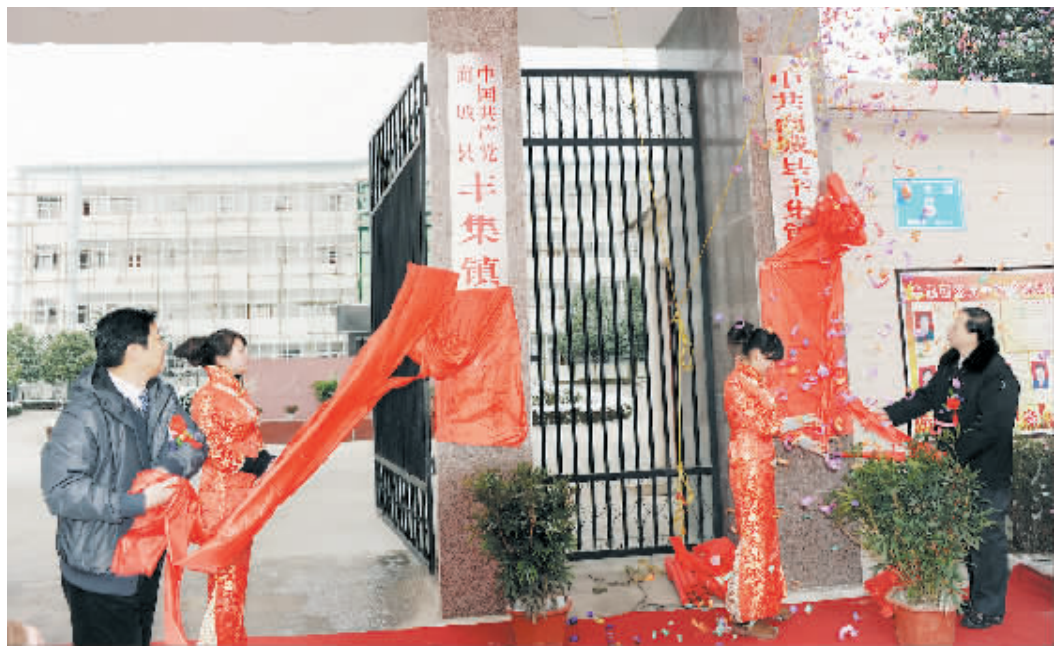
商城县领导为丰集揭牌

检查、评比、奖惩制度,加强日常巡查管理和各项制度落实,保证集镇日常管理做到规范化;在曹楼、陶庙、张寨、王集、施寨、洞冲、青山等村新建“组组通”水泥路10公里,彻底解决了21个村民组约4500名群众的出行难问题;高标准新建了王集、白龙岗、曹楼等3个村级活动场所,5个村级文化大院和2个农家书屋;大力开展“四围三路两品一网”植树活动,“四围”是指村部、学校、卫生室、科技服务站周围;“三路”是指乡村路、村组路、渠系路;“两品”是指