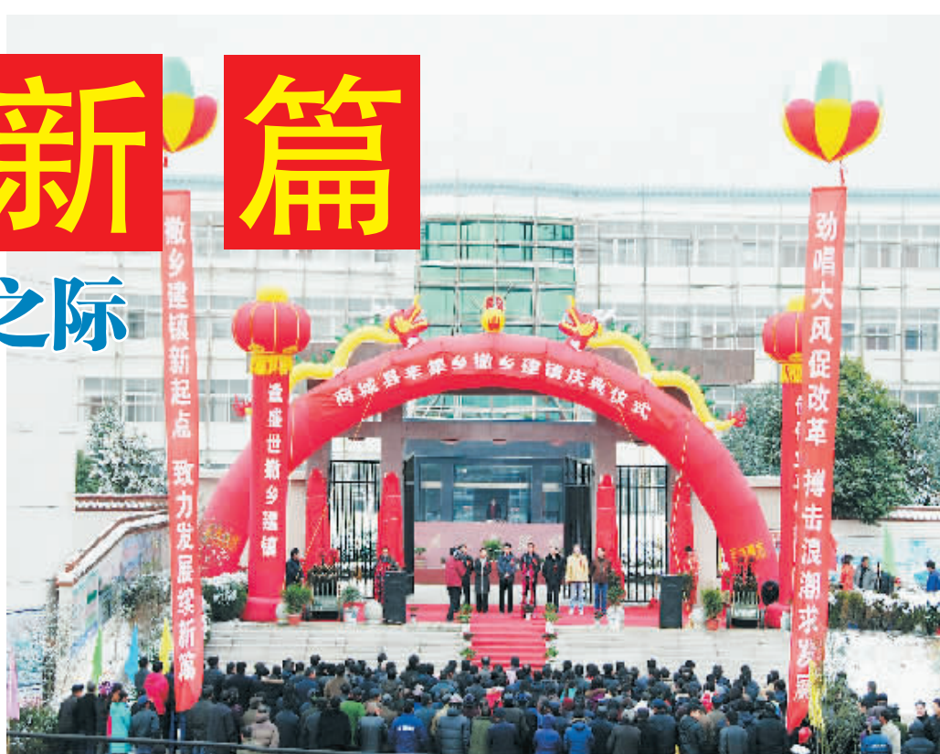
丰集撤乡建镇庆典仪式现场

集镇建设日新月异。镇政府驻地丰集镇街,自古为商贸重镇,商贾云集。近年来,为改变集镇面貌,增强集镇功能,优化发展环境,丰集镇以六城联创为契机,按照《丰集镇2005年—2020年集镇建设总体规划》,加大集镇基础设施建设投入,实施“硬化、亮化、绿化、美化”工程,集镇配套设施完善。已累计投入资金4600万元,在丰集镇街先后开辟两横三纵共5条,长1200米的双面街道,改造老街道1500米,改造排水道4000米,街道两边全部铺设人行道彩砖,安装路灯,配建绿化带。建成停车场1座,兴建公厕2处,建垃圾填埋场1座,两级休闲广场2处,新建了880平方米的小商品集贸市场1个、农产品交易市场1个,市场内实现了规划划市