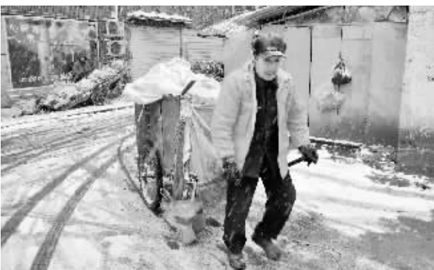
雪大路滑,环卫工人吃力地往垃圾中转站运送垃圾。