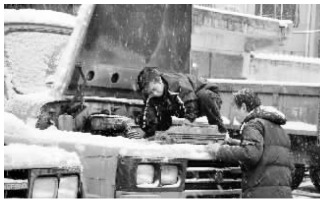
市环卫处机械修理厂师傅抢修机械,保证垃圾日产日清。