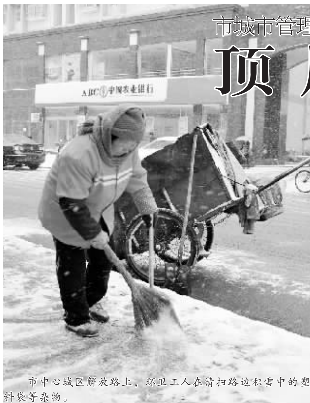
市中心城区解放路上,环卫工人在清扫路边积雪中的塑料袋等杂物。