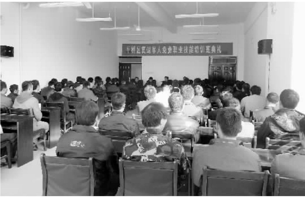
为进一步拓宽退役军人安置渠道,提高退役军人的基本劳动技能和就业竞争能力,日前,平桥区人民政府举办了退役军人免费职业技能培训班,100多名退役士兵参加了培训。此次培训设有汽车驾驶与维修、计算机、数控机床、信阳菜烹饪等16种专业。