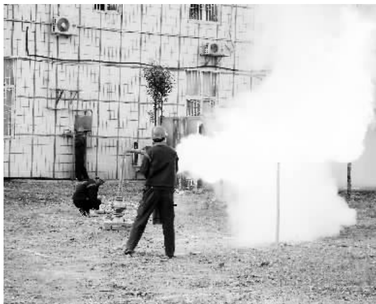
近日,信阳市富地燃气有限公司举行了一场应急演练综合大演练。此次演练共包括办公楼紧急疏散、实操灭火演习、CNG抢险演习3个大项,公司8个部门的50余名员工参加了此次演练。图为演练现场。