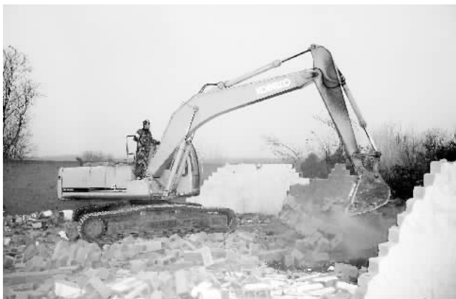
为维护城市规划建设法律、法规尊严,顺利开展非法占地私搭乱建抢建抢建专项整治活动,严厉打击违法建设行为,根据《中华人民共和国土地管理法》、《中华人民共和国城乡规划法》的相关规定,12月14日,在市政府的统一领导下,羊山新区、信阳工业城、城市管理局综合执法局、市公安局等多部门联动,同时对市高铁站区域内的违章建筑进行了强制拆除。此次强制拆除行动,共拆除违章建筑44处,共计15200平方米。图为违章建筑拆除现场。