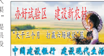
办好试验区 建设新农村 “大于三个月 打赢六场硬仗” 中国建设银行 建设现代生活

本报讯(叶辉)在近日召开的河南省自强模范暨扶残助残表彰大会会上,罗山县残疾人托养中心被河南省人民政府残疾人工作委员会授予“残疾人之家”荣誉称号。 据悉,该中心于2009年9月建成并投入使用,占地78亩,五大政策因素支撑民生增收:一是逐步提高小麦、稻谷最低收购价,拉动市场粮食价格回升;二是实施一系列扶持政策,稳定和促进农村劳动力转移就业;四是国家加强农村农业基础设施建设,改善农村生产生活条件;五是积极深化农村改革发展,推动农业生产力和比较效益的提高。 社会保障体系在探索中加快完善。社保是民生之依,在经济发展中发挥着安全阀和减震器作用。“十一五”时期,特别是信阳被确立为河南省农村改革发展综合试验区以来,全市解放思想,创新思路,大胆探索,进一步加快社会保障领域改