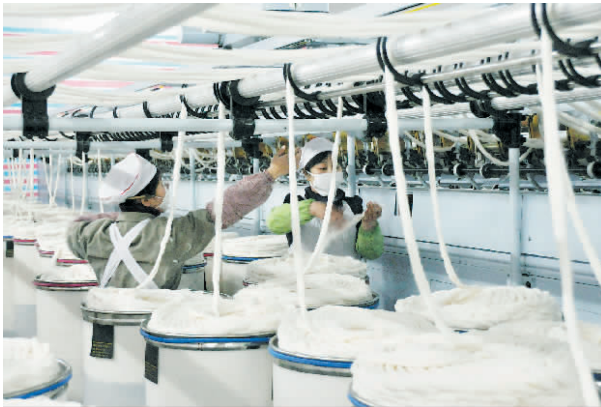
澳门合德金融投资有限公司投资9.8亿元建成的河南省合昌纺织科技有限公司,自今年年初签约落户息县,到本月初正式投产,仅用了7个月时间,被业内誉为“息县速度”。图为该公司生产车间一角。

本报讯(记者 周海燕)自“华英农业”富民计划实施以来,商城县委、县政府把此项工作作为一项政治任务和富民产业抓紧抓好,在市富民办、华英集团及有关部门的支持下,顺利实现“两年任务一年完成”的目标。截至11月底,全县已开工建设养殖小区39个,已建成36个,开养32个,已出售合格成品鸭28万余只,每只利润在2元左右。 领导重视、强力推动是保障。自“华英农业”富民计划实施以来,市委、市政府领导经常驱车简从,深入商城县养殖小区进行调研、检查、指导,并悉心解答部分养殖户的咨询,这对全县的工作是巨大的推动,对广大养殖户也是极大的鼓舞。县里主要领导多次主持召开专题会,研究制定各项优惠政策,多次深入各个养殖小区,现场协调解决具体问题,为“华英农业”富民计划在全县顺利实施提供了坚强的保障。 齐抓共建、部门联动是关键。该县各相关部门按照市委、县的统一安排,充分发挥职能作用,创新服务方式,简化办事程序,优先优质服务“华英农业”富民计划,形成了齐抓共建的良好工作格局。华英集团的支持服务很到位,技术人员随叫随到,及时给予技术指导,充分展示了华英集团的团队精神和服务意识。