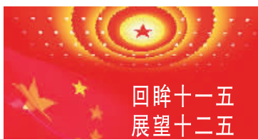
责编:张国亮 审读:庭军 组版:邱夏

革,信阳社会保障体系进一步完善。目前,全市已初步建立了以社会保险、社会救助、社会福利为基础,以补充保险、慈善事业、商业保险为补充的多层次的社会保障体系,社会保障覆盖范围逐步由国有企业向各类社会经济组织、由单位职工向灵活就业人员、由城镇居民向农村居民扩展,以就业人员保障为主的单位福利制度逐步转变为覆盖城乡居民的社会保障制度,民生得到了日益全面、到位的保障和改善。 “心中为念农桑苦,耳里如闻饥冻声。”为解除广大农民的后顾之忧,让他们真正老有所养,市委、市政府在广泛调研、充分论证的基础上,启动了新型农村社会养老保险,出台了农民社会养老保险实施办法,并在罗山县等地进行试点,农民兄弟首次像城镇居民一样享受到社会养老的喜悦和保障。(下转第二版)