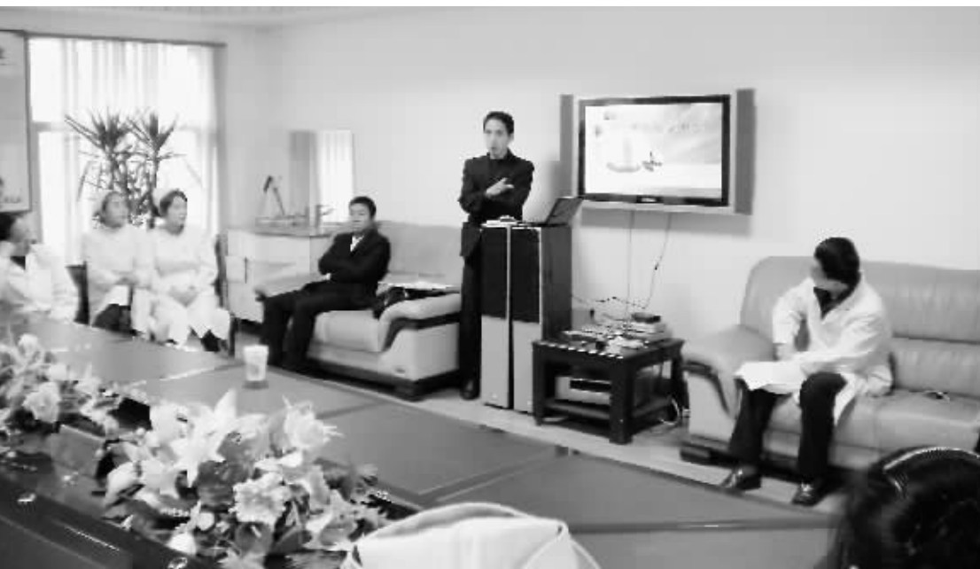
12月1日,市精神病医院组织专场消防安全知识培训。培训中,有关专家就提高消防安全意识、安全用电、消防器材的配备和使用、防火灭火常识及火场逃生等进行了生动地讲解。讲座普及了消防安全知识,对提高职工用电安全、冬季防火安全将产生积极作用。