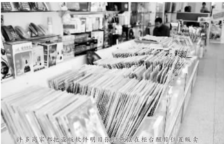
许多商家都把盗版软件明目张胆地摆在柜台醒目位置贩卖。