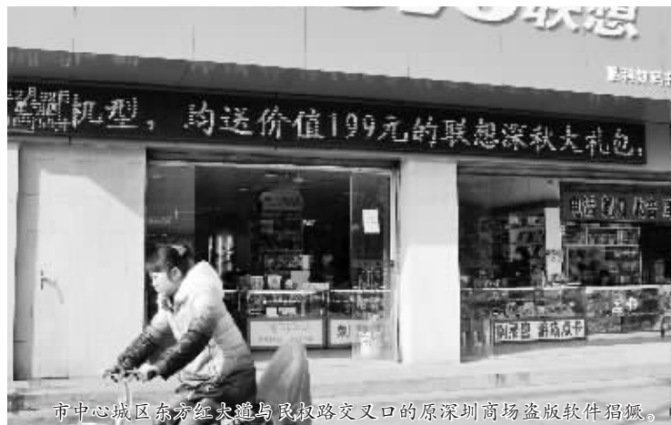
市中心城区东方红大道与民权路交叉口的原深圳商场盗版软件猖獗。

较严,风险大,卖得贵些,每张碟10元。在记者调查期间,发现好几个学生模样的年轻人也在电脑城里选购软件。女老板立即抛下记者,开始热情地招呼他们去了。记者又来到信阳火车站附近