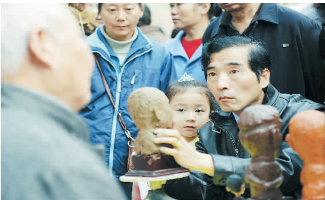
11月28日，一名小女孩在看民间雕塑家展示塑像艺术。当日，武汉市青山区开展“送岗位、送文化、送维权、送健康”服务活动，工会、共青团、妇联等部门联手，通过组织用工企业招聘下岗职工，组织卫生工作人员为群众进行健康咨询，提供法律援助、开展文化等活动等形式，为群众服务。