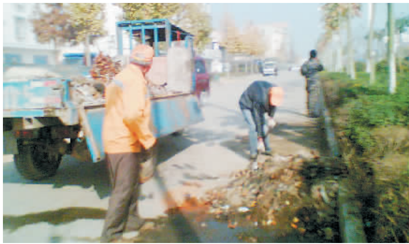
入冬以来,市区建筑工地、家庭装修施工向主干道倾倒、抛洒建筑垃圾现象较多,由于环卫工人力量有限,严重影响了正常的环卫清扫保洁作业,破坏了良好的卫生环境。市环卫部门呼吁广大市民养成良好环境卫生习惯,共同营造干净整洁的卫生环境。

3个乡(镇)坚持每天及时收集、清运生活垃圾。3个乡(镇)垃圾中转站每天分别运送生活垃圾两车10余吨,有效地解决了多年来生活垃圾无处堆放、无法处理“两难”问题,改善了3个乡(镇)农民生活环境,保障了环南湾湖水安全,推动了该区农村改革发展综合试验区建设。