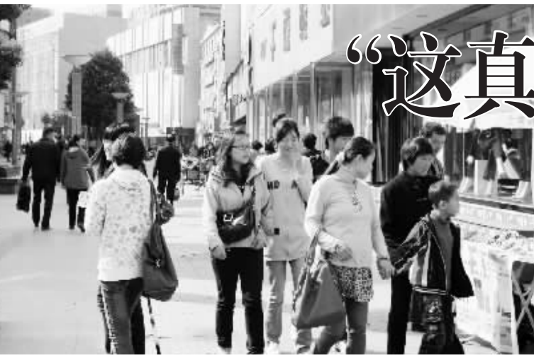
步行街上休闲购物的人们。