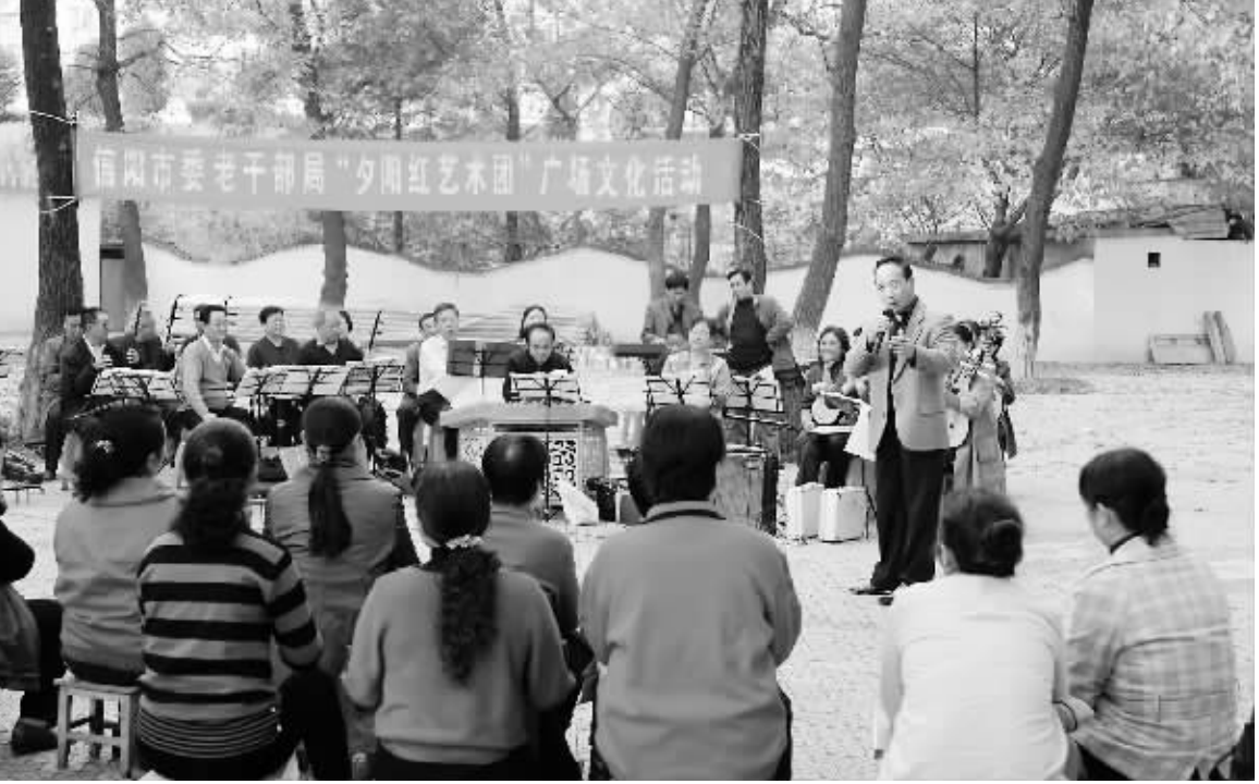
我市“夕阳红艺术团”是由离退休的老人自发组织起来的民间文艺团体，这些老人利用节假日，带着乐器来到浉河公园为前来游玩的市民演出，受到市民欢迎。图为表演现场。

人口普查工作正在如火如荼地进行着，我们每个人都应积极参与其中，用微笑面对微笑，支持普查员的工作。但要想知道全国具体有多少人，还要等到普查工作结束后，由国家统计局和国务院对数据进行审核才能发布。