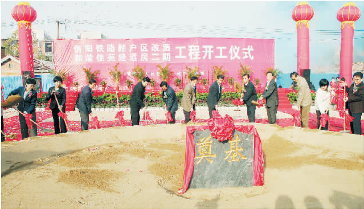
图为省、市、武汉铁路局领导共同为工程奠基。