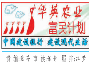
责编:陈玲 审读:陈金 照排:江梦

户们通过科学管理,精心饲养,取得了良好养殖效益。在投产的10个养殖小区中,有5个养殖小区已出售成鸭3批,4个养殖小区已出售成鸭2批,平均每批获利1.8万元。