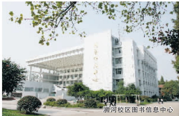
漯河校区图书信息中心