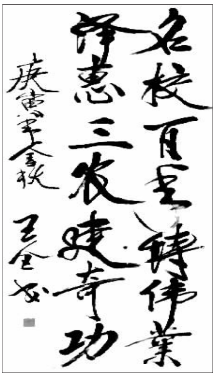
河南省政协主席王全书为信阳农专百年校庆题词