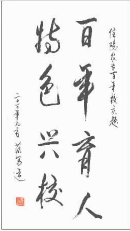
河南省委高校工委书记、教育厅厅长蒋笃运为信阳农专百年校庆题词