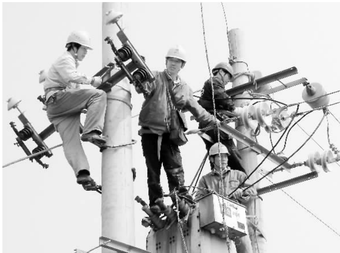
连日来,信阳供电公司农电服务人员到农村配网进行全面检修,及时消除设备缺陷,提高供电可靠性,为迎峰度冬提供保障。图为10月11日,信阳供电公司兰店供电所员工对10千伏高7线柱上开关进行移位安装。

并将学习活动作为创先争优活动的一项重要内容,紧密联系实际,开展多种形式的学习活动:把学习活动与机关建设先行活动紧密结合,充分发挥机关核心和统领作用;把学习活动与加强班子建设紧密结合,建设大局意识强、领导能力强、团结和谐、业绩突出的坚强领导集体;把学习活动与加强班组建设紧密结合,培育班组团队文化,打造创新型、学习型、复合型班组,为实施“一体两翼”发展战略,打造猎鹰团队,全面完成今年各项工作任务提供坚强的保证。