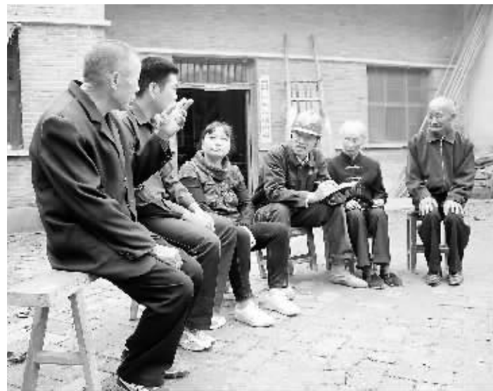
10月12日,潢川县电业局付店供电所员工利用秋收农闲间隙,走访农村客户,了解村民用电需求。