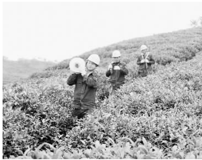
信阳供电公司大力加强电网建设,积极服务“信阳红”的发展。图为10月14日,该公司供电员工在浙河区董家河镇开展服务时的情景。