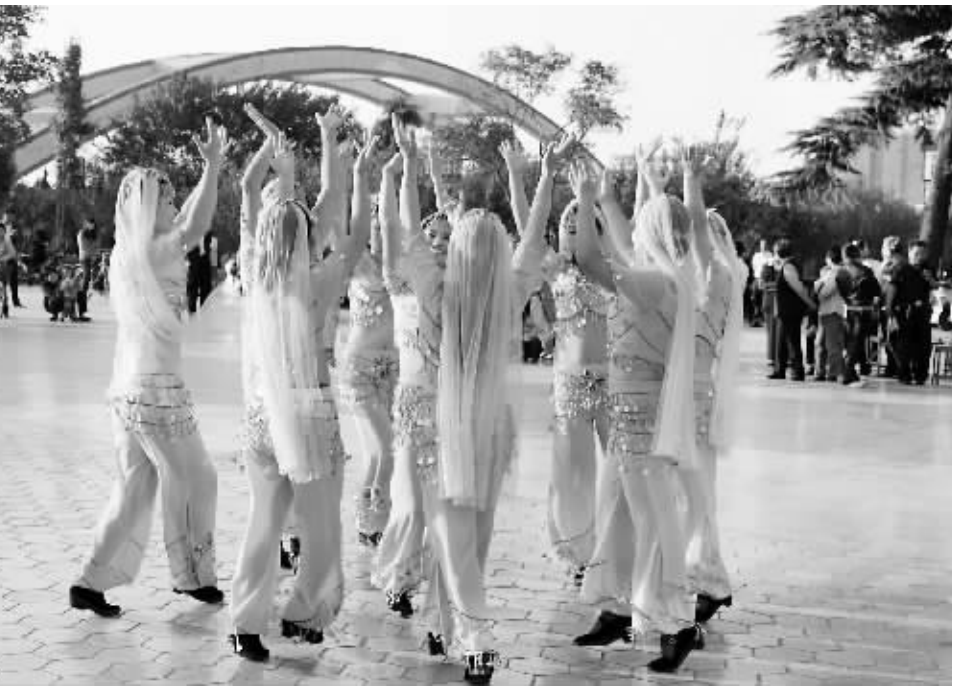
10月16日,浙河区“民歌飞扬·唱响信阳”专场文艺演出在市天伦广场举行。演出由浙河区人口计生委主办,所表演的节目均由浙河区各个乡镇、办事处选送。图为演员正在演出时的情景。

由于博物馆目前还在建设当中,许多方面还有待完善,老师和同学们通过这个实践基地,能够更多地关注信阳的历史和文化,更深入地研究社会的发展和变化,在学习实践中积累知识、增长才干。同时,信阳博物馆借信阳师范学院历史文化学院建立教学实习基地的契机,进一步拓展博物馆的社会教育及文化服务功能,努力为提高广大人民群众的素质发挥积极作用。