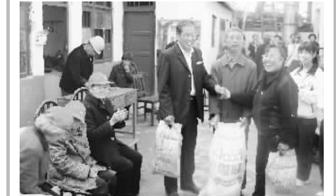
重阳节当天,我市各行各业开展各种各样的关爱老人活动,以不同的方式表达对老人的爱心。图为一企业到市夕阳红敬老院慰问的情景。