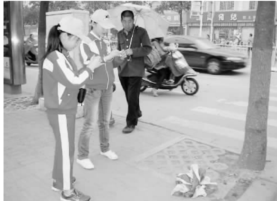
在“小手拉大手 共建魅力城”活动中,红领中黑猫警长近日起照相机,搜索记录不文明行为,通过美丑对比,警示恶习,倡导社会新风,推动向“乱扔杂物说‘不’”活动的深入开展。

信阳师范学院党委高度重视这项工作,学院组织部兼统战部部长都火星教授出席会议并作了专题辅导报告。都火星教授从社会主义核心价值体系的四个方面详细阐述了社会主义核心价值体系的内涵和逻辑结构,并勉励学院民盟盟员认真学习和掌握社会主义核心价值体系的基本内涵,不断提升思想境界,端正工作态度,努力做好本职工作,为学院的发展贡献力量;为信阳市的科学发展、和谐发展多做贡献。