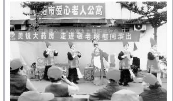
重阳节前夕,市民政局、美锐大药房及信阳职业技术学院护理系的学生们来到市爱心老人公寓慰问,并为老人们表演了精彩的文艺节目。