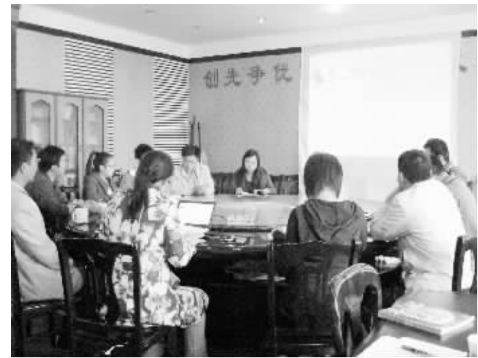
针对我市园林专业人才短缺现状,市园林局出台相关意见,支持在职人员通过自学提升专业水平。图为市园林局日前邀请华中农业大学教授对该局报考风景园林专业在职研究生的人员进行培训。