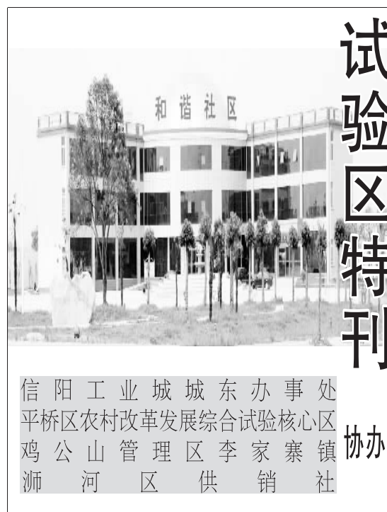
信阳工业城城东办事处 平桥区农村改革发展综合试验区核心区 鸡公山管理区李家寨镇 浉河区供销社