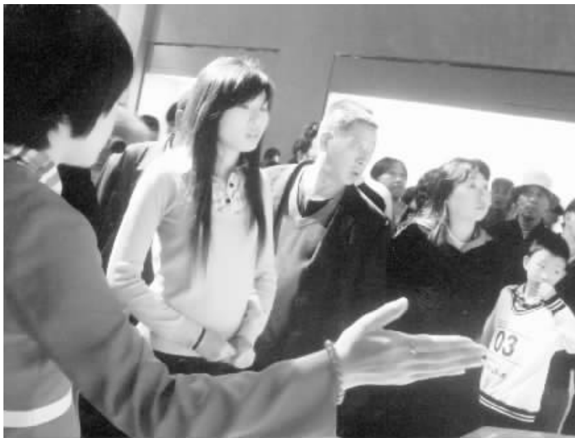
重阳节前夕,潞河区工业和信息化局党委组织局机关离退休老同志参观了市博物馆、百花园和湿地公园等景点。许多老同志对我市近年来的发展变化赞不绝口,他们说,信阳市最近几年的变化真是喜人。图为该局的老同志在市博物馆参观时的情景。