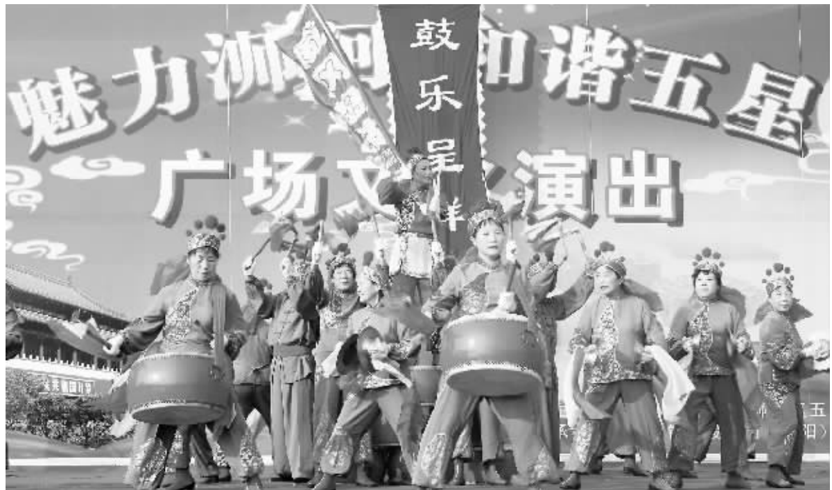
为加强文化广场建设、丰富群众文化生活,日前,浉河区五星办事处举办了以“魅力浉河和谐五星”为主题的广场文化演出活动,受到群众的广泛好评。图为活动现场。