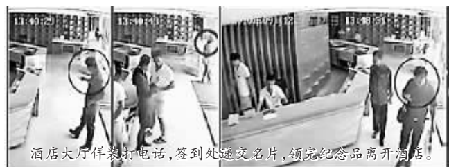
酒店大厅内,记者看到,酒店工作人员正在给客人提供服务。

冒充客户代表、业务经理甚至媒体人员混吃、混喝,临走还带份纪念品。9月12日,在某新品推介会上,20分钟内就来了两个“会虫”,其中一人还假冒《长江日报》记者。记者随后采访多家星级酒店了解到,“会虫”让会议主办方防不胜防。