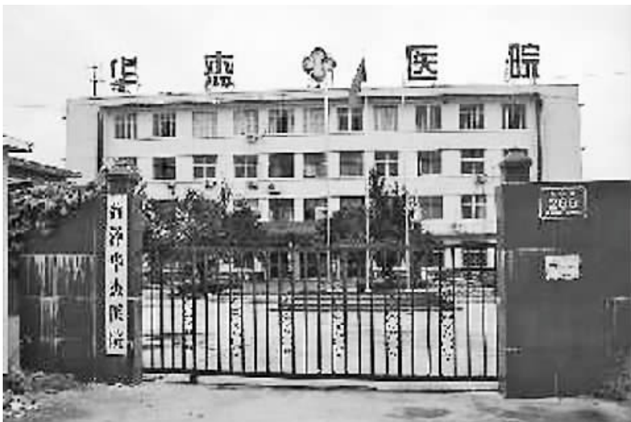
菏泽华杰医院以免费“两癌”筛查为名骗取617名育龄妇女接受体检体检后绝大多数被告知有妇科病。

政府补助、车接车送、免费体检,真有这样的“好事”?7月下旬至8月中旬,主治性病的一家民营医院——菏泽华杰医院,以组织免费“两癌”筛查为名,在成武县骗得600多名育龄农村妇女接受体检,绝大多数被告知有妇科病,并被危言耸听地“建议”接受LEEP刀手术。结果96人接受手术治疗后,身体出现严重不适。