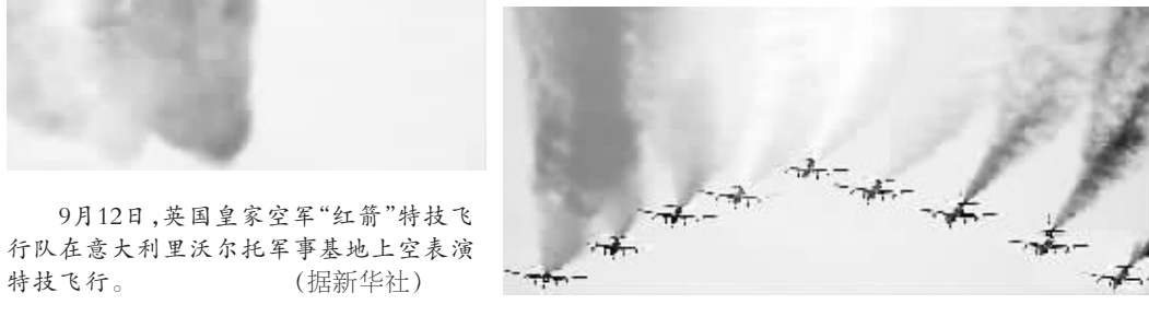
9月12日,英国皇家空军“红箭”特技飞行队在意大利沃尔托军事基地上空表演特技飞行。(据新华社)