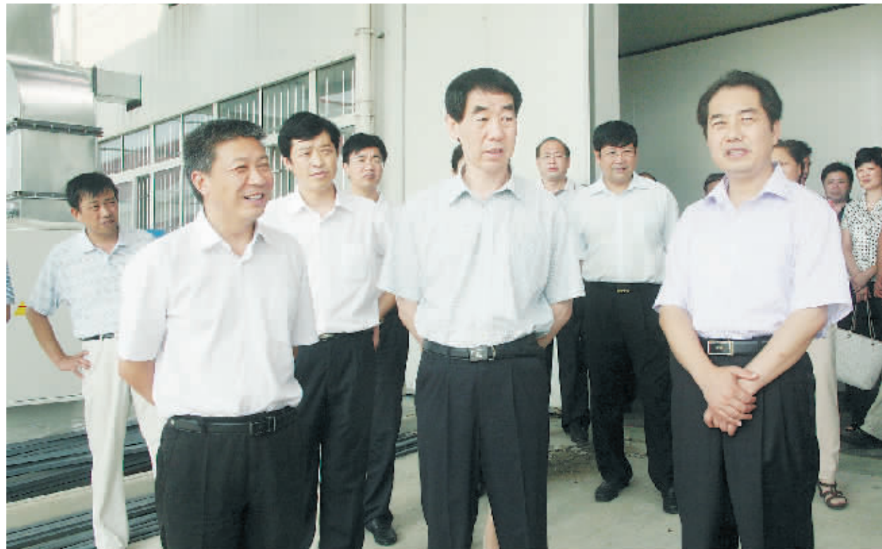
市委书记王铁(中)在平桥区调研指导工作

平桥区位于河南省南部、淮河上游,享有“北国江南、江南北国”的美誉,全区面积1889平方公里,人口78万人,已形成农业特区、工业强区、花园城区。平桥历史悠久,楚国故都城阳城遗址就在该区境内,1957年在城阳城出土的战国青铜编钟,精美绝伦,奏响的《东方红》乐曲,随着我国第一颗人造地球卫星而响彻寰宇。