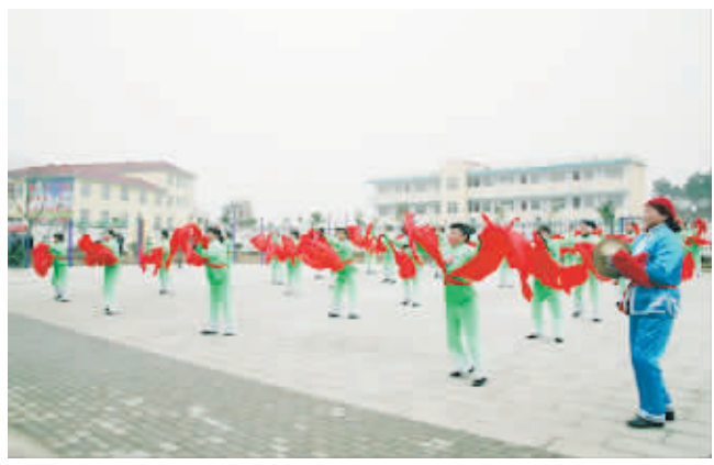
丰富多彩的农村文化生活

平桥区着力增强文化影响力,提升文化软实力,文化产业气象一新。广场文化独树一帜,声名远扬。平桥世纪广场被文化部评为全国35个“特色文化广场”之一。胡店乡石榴文化广场每晚都有几百名群众载歌载舞,该区成立6家文化剧团、29支电影放映小分队,把“流动舞台”、“活动影院”搬到了老百姓家门口,实现了“月月放、村村演”。在旅游文化上,把新农村、新文化、新旅游有机结合起来,延伸文化触角,提高文化附加值,大力实施旅游山区战略,打造了震雷山湿地公园、中华石榴城、震雷山风景区、天目山风景区、陆庙核心区等一批旅游精品点。搭建