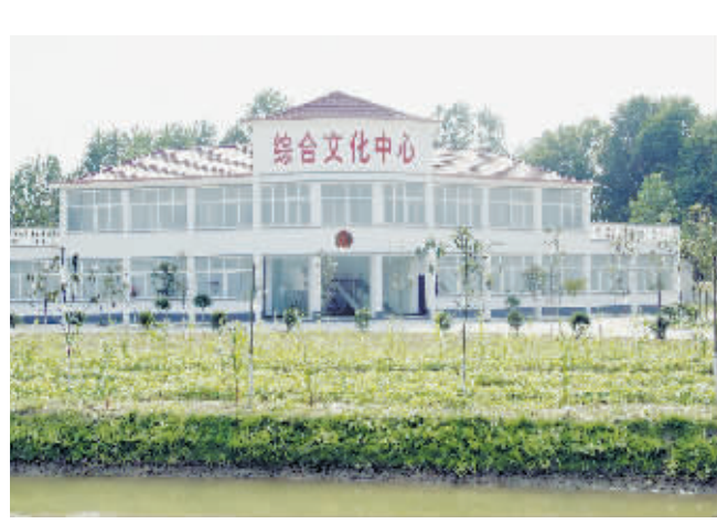
新颖别致的乡(镇)综合文化中心

号角激荡着历史的使命,理想鼓舞了奋进的豪情。站在新的起点,平桥区将坚持精神抖擞、精益求精、精诚团结的平桥精神,按照省委“能快则快,快中求好”的原则,在市委、市政府的正确指引下,在“产业”上用功,在“统筹”上发力,在“保障”上提升,高扬承载着平桥人意志、魄力、智慧的旗帜,让承载着78万平桥区人民改革梦想的脚步越走越快,激情谱写出平桥区农村改革发展的绚丽篇章。