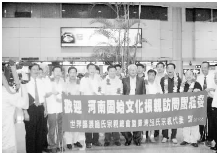
台湾各界人士在机场热烈欢迎方波一行的到来