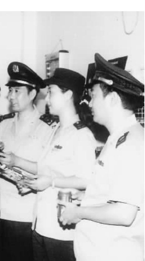
今年以来,市工商局专业分局不断加大加大对娱乐场所经营商品的质量检查力度,以维护消费者的合法权益。图为近日该分局工作人员向一娱乐场所商品销售人员了解商品进货渠道情况。