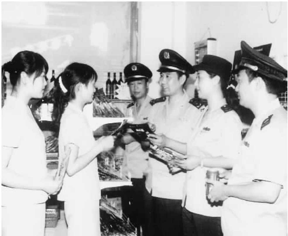
今年以来,市工商局专业分局不断加大加大对娱乐场所经营商品的质量检查力度,以维护消费者的合法权益。图为近日该分局工作人员向一娱乐场所商品销售人员了解商品进货渠道情况。