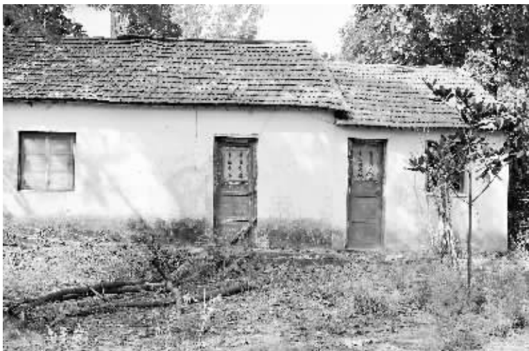
破败不堪的房屋严重威胁着农民兄弟生命财产安全。

村危房改造试点工作列入“十大民生工程”。我市今年要完成8000户的农村危房改造任务,时间紧迫,任务艰巨。市住房和城乡建设部门负责人表示,他们将主要采取以下措施确保住房困难农户如期搬出危房。一是组织得力人员,健全相关组织机构,加强对相关工作的领导。对没有特殊情况完不成目标任务的县区,提请市政府进行问责。二是严格落实建设要求。坚持因地制宜、经济实用和最贫困、最危险等原则,满足房屋基本居住功能。三是认真组织,科学编制实施方案。在综合考虑实际需求、管理能力、用工量、农户自筹资金能力等因素的基础上,将改造任务细化分解到乡镇(镇)和村(庄),确保实施方案科学、合理、可行。四是严格程序,抓好农村危房鉴定。五是搞好调查,合理确定补助对象。六是充分调研,合理确定