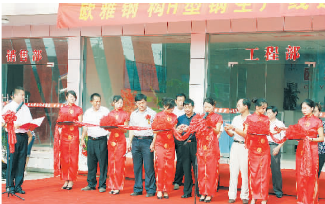
昨日上午,信阳市欧雅钢结构有限公司钢构H型钢生产线建成投产仪式在信阳工业城举行。信阳市欧雅钢结构有限公司成立于2000年,是一家集钢结构设计、生产、销售、安装为一体的民营企业,拥有钢结构工程专业承包三级资质。该公司设备先进,现拥有国内一流的H型钢、C型钢、彩瓦钢、夹芯复合板生产线,是一家生产设备先进、品种齐全、规模较大的钢结构专业企业。图为庆典现场。

招聘启事 招聘单位:河南悉诺信息技术有限公司 工作地点:信阳市 招聘对象:汽车驾驶员 待遇:工作环境好和薪酬待遇较高,办理五险一金 报名条件:年龄在25至30周岁,男性,驾龄三年以上,应聘者要身体健康,形象端正,性格沉稳,责任心强,部队复员或有给领导开车经验者优先考虑。 有意者请将个人简历、联系方式及近期照片发至15037660849@139.com,我单位审核后通知符合条件的应聘者参加面试和路考。 报名时间:2010年8月20日至2010年8月23日 联系人:苏先生 电话:15037660849 河南悉诺信息技术有限公司 2010年8月18日