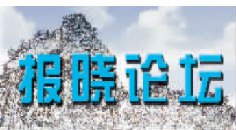
责编:陈晓军 审读:庭军 组版:江梦

二、一以贯之推进新跨越 “三具两基一抓手”,是卢展工书记交给我们抓工作、抓落实的“点子上”、“路子”、“法子”。如何用好、活用这一新方法,需要抓住“三具”关键点,筑牢“两基”立足点,打牢“一抓手”切入点,全面把握,整体联动,一以贯之,形成合力,让潢川科学发展、跨越发展的根基更牢固。 (下转第二版)