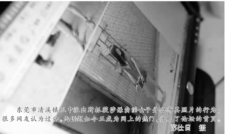
东莞市清溪镇三中派出所抓获涉嫌卖淫女子并公布其照片的行为,很多网友认为过分。此话题如今成为网上的热门,并上了热搜的前页。