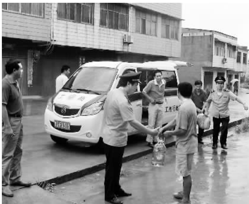
近期,平桥工商分局和平桥区个体私营协会组织开展了“为困难个体工商户送温暖”活动。平桥工商分局有关负责同志带领数个慰问组,深入平桥镇各街道、集市开展慰问活动,为困难个体工商户送温暖。图为慰问时的情景。

工作开展好、落实好。二要狠抓落实,全面开展。进一步摸清底数,集中时间开展培训,力争在9月10日前将全市所有生产经营单位、学校、公共聚集场所的注册安全员培训完毕。三要密切配合,不留死角。各部门、各单位要加强沟通交流,搞好衔接,抓好统计,确保公共聚集场所注册安全员持证上岗,同时,积极开展回头看工作,确保实效。四要加强指导,树立典型。加强对注册安全员队伍的交流指导,积极宣传先进事迹和先进个人,确保注册安全员队伍充分发挥作用。