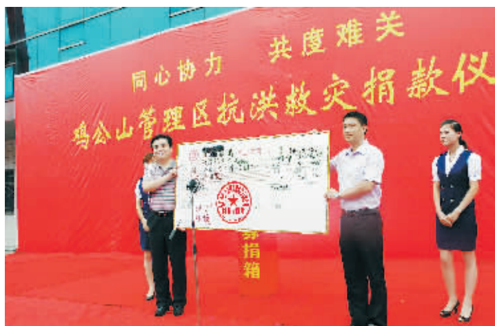
7月22日,鸡公山管理区举行了抗洪救灾捐款活动。捐款仪式上,志高集团捐款20万元,信阳创新置业、新纪元房地产等驻山企业纷纷响应,区属机关单位及个人踊跃捐款。当日,共收到捐款89.6万元。图为志高集团捐款时的情景。

本报讯(梅建新 阮成国)为搭建全民创业服务平台,提高全民创业意识,加快魅力信阳建设步伐,提升我市创业之品牌,市人力资源和社会保障局于近日开通“信阳创业网(www.xysew.com)”。 该网站分10个板块:“创业项目库”为下岗失业人员、大学毕业生、返乡农民工等有意创业的朋友,提供投资少、市场前景好、见效快的创业项目;“创业快报”及时反映全市全民创业信息;“创业政策法规”发布全民创业有关法律法规、政策文件和新举措;“创业