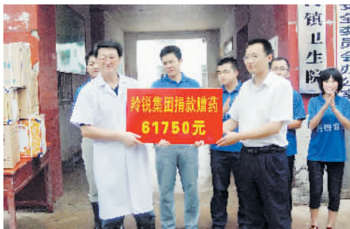
连日来的降雨,使新县苏河镇、千斤乡出现严重内涝,群众财产遭受损失。灾情发生后,羚锐公司迅速把33000元现金和价值近40000元的药品、食品及雨具送往灾区。图为羚锐集团志愿者向苏河镇卫生院捐款赠药时的情景。