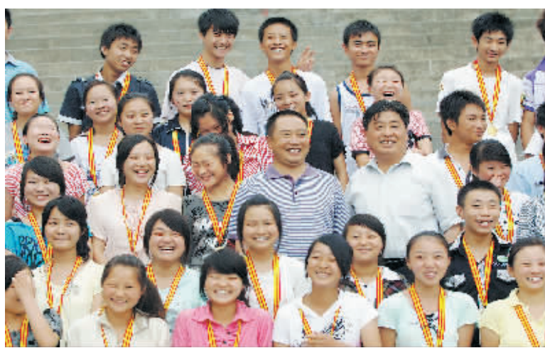
同学们与朝夕相处3年的老师合影留念。

7月16日,重庆市南川区三全镇马嘴东州春蕾小学初三年级举行毕业典礼,在全年级100名留守儿童中,有59名考入区重点高中,41名考入普通高中,他们为自己3年的初中生涯画上了圆满的句号。 重庆市南川区三全镇马嘴东州春蕾小学共有学生1299名,其中67%都是留守儿童。该校自2006年成立“留守儿童之家”以来,先后有2000多名留守儿童在此就读。学校为了让留守儿童过上“家庭式的校园生活”,配备了“家长式的教职员”。教职员既是留守儿童学业上的良师,又是生活中的“代理父母”。孩子们在学习的同时,能感受到来自大家庭的温暖。