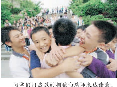
同学们用热烈的拥抱向恩师表达谢意。

至少1米以上,安全隐患十分明显。 在群众多次反映情况后,小河镇政府组织机械对河道进行了清理,但刚挖一点就停了,仅把桥下的河道挖到大约2米深,其他河段就没有疏通了。随后,当地群众还准备筹资请人清理,但也没来得及实施,悲剧已然酿成。 俗话说“大旱之后必有涝”,云南省今年遭遇历史罕见的特大旱灾,即使在抗旱救灾尚未结束的时候,全省就做出了准备抗洪的安排部署。小河镇位于金沙江流域的炉房沟与银厂沟交汇地带,由于当地生态脆弱,历史上也是洪涝灾害高发地区。