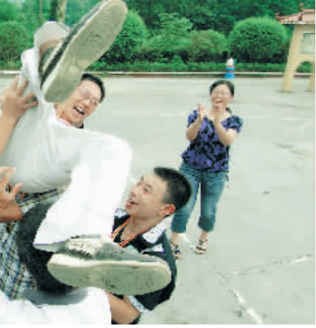
同学们将3年来朝夕相处的部位星老师抛向空中,以此表达谢意。